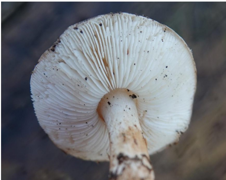
Lepiota obscura (Locq.ex Bon) Bon, 1993 - Agaricales - Agaricaceae