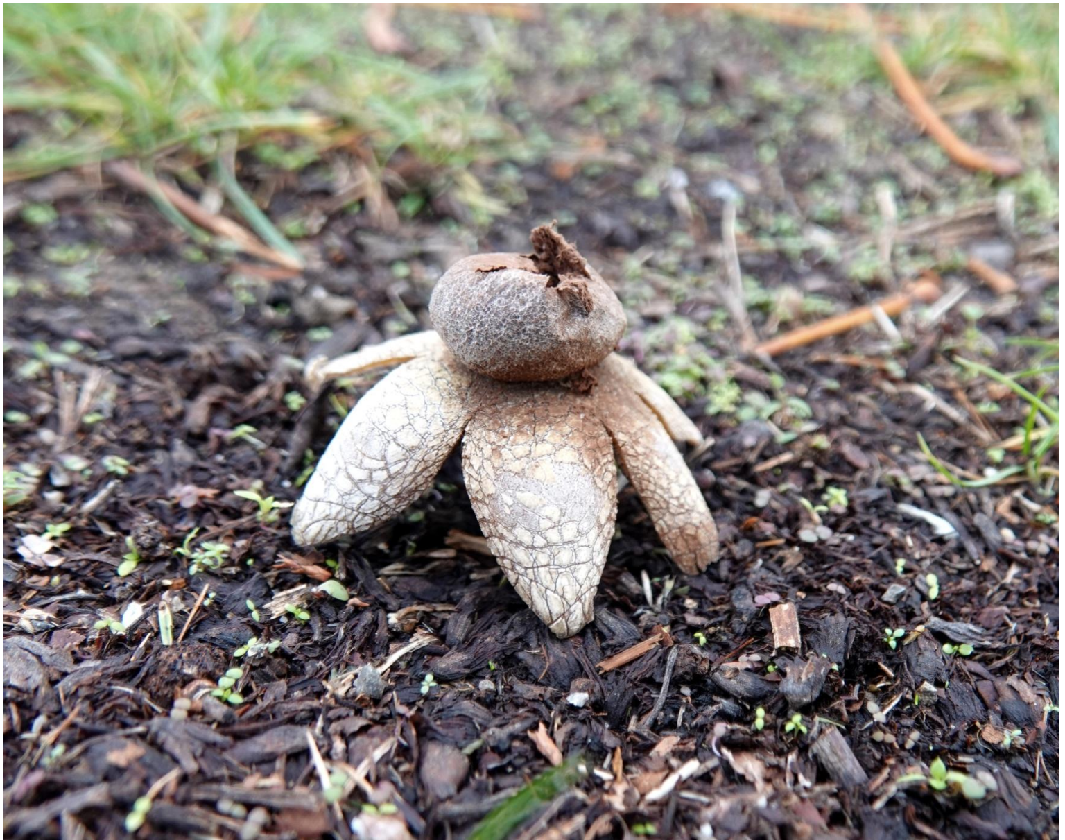
Astraeus hygrometricus (Pers.) Morgan, 1889 Géastre hygrométrique - Boletales - Asteraceae