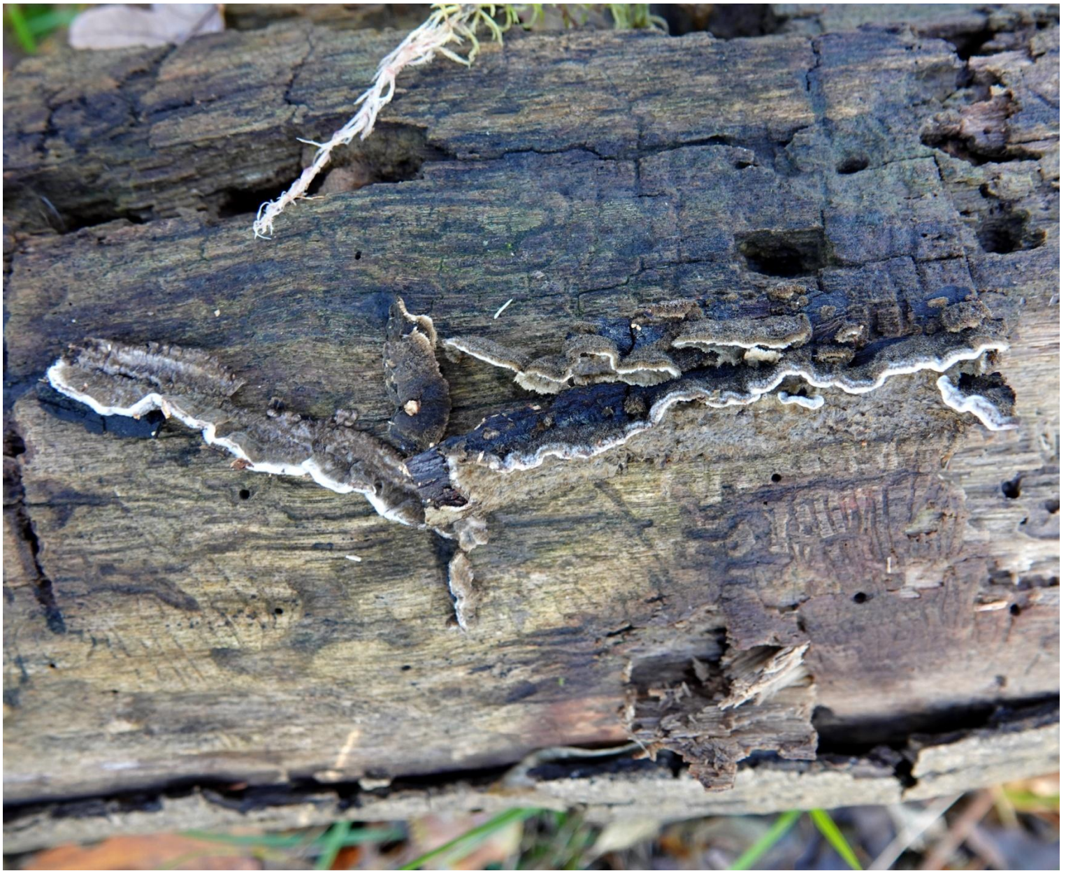
Porostereum spadiceum (Pers.) Hjortstam & Ryvarde, 1990 Polyporales - Meruliaceae