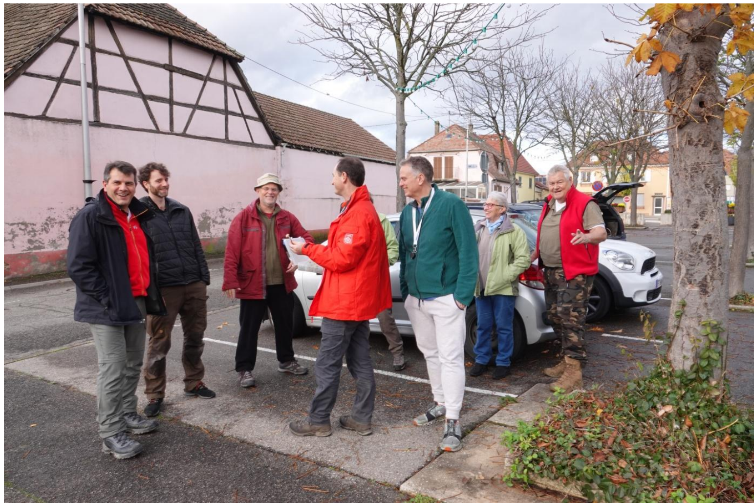
Lieu du rendez-vous à BIESHEIM