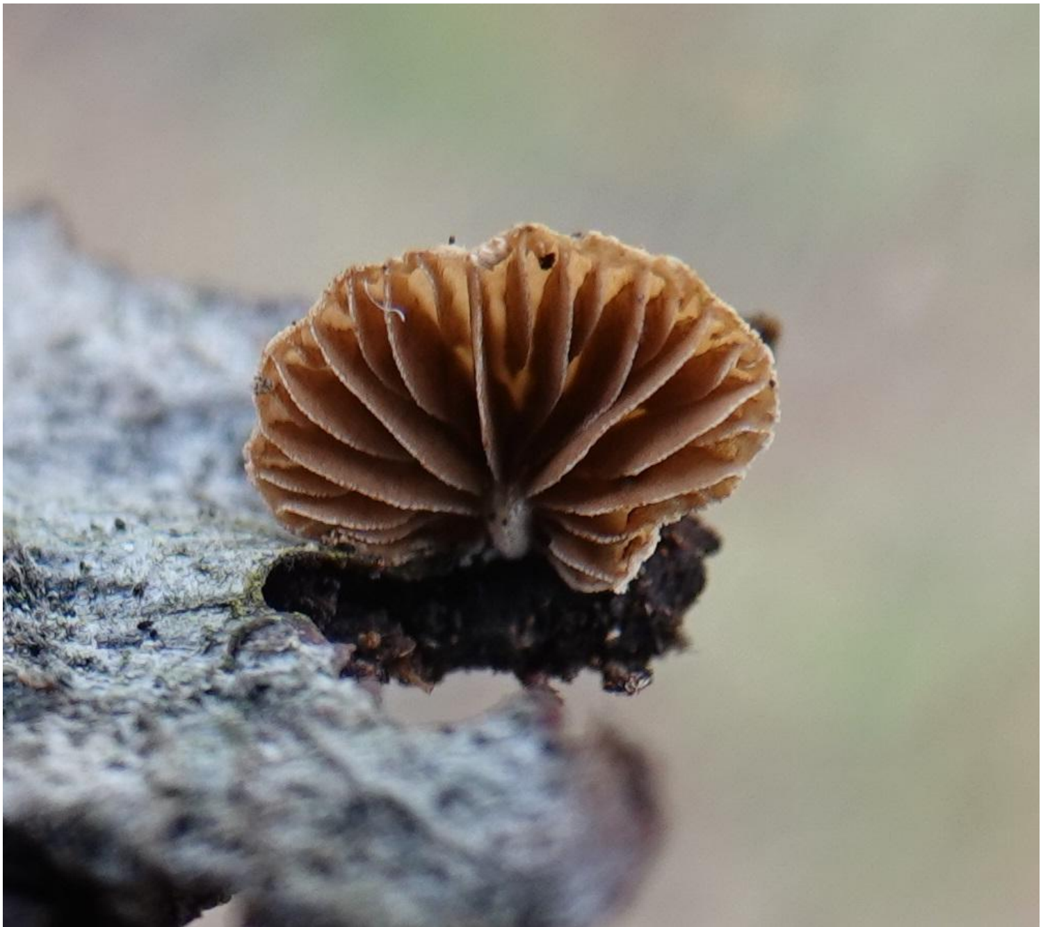
Phaeomarasmium rimulincola (Rabenh.) Scherff., 1914 Agaricales - Tubariaceae