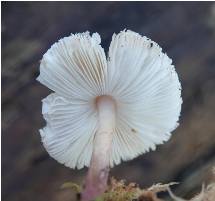
Leucoagaricus ionicolor Bellù & Lanzoni, 1988 - Agaricales - Secotiaceae