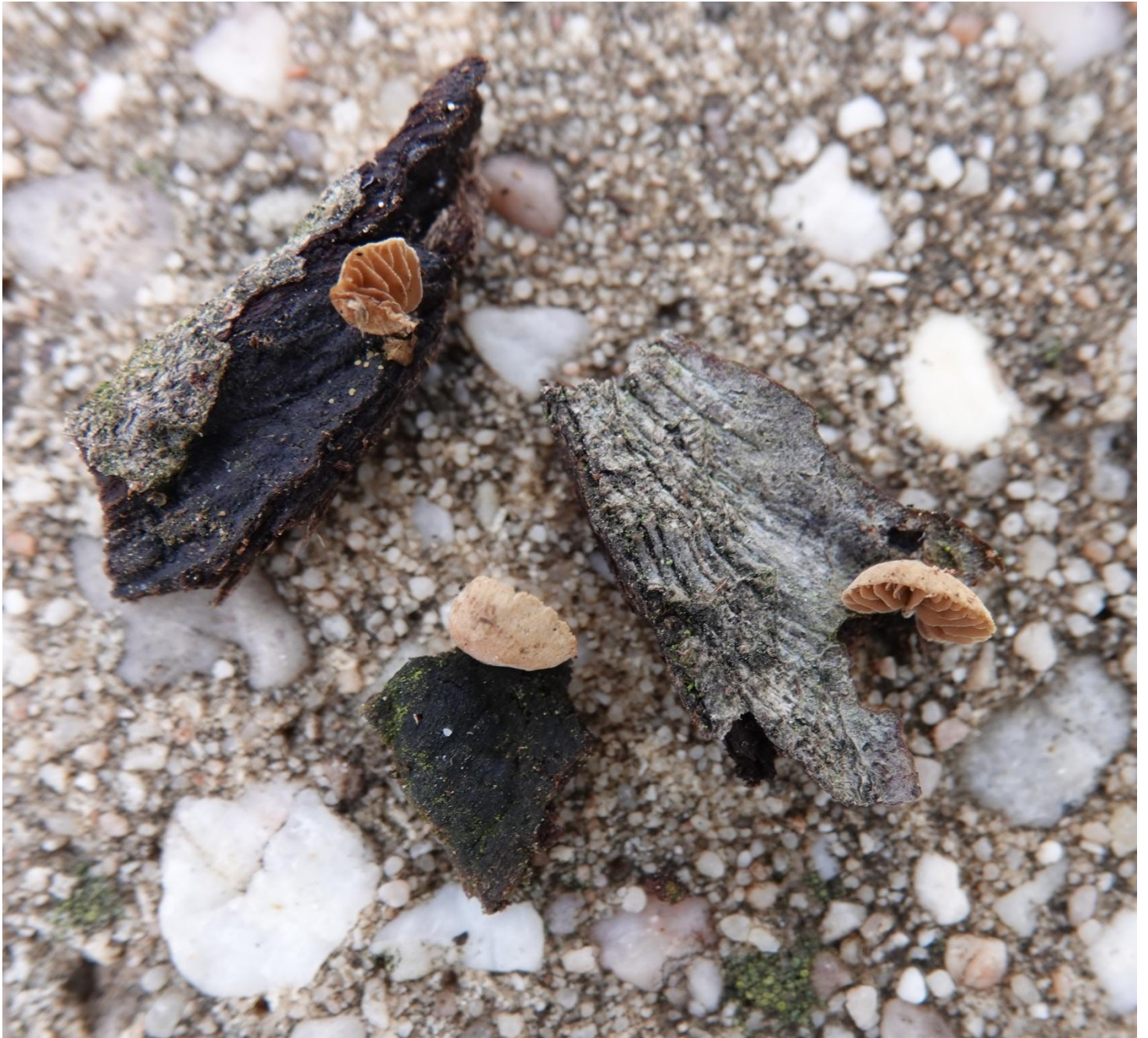
Phaeomarasmium rimulincola (Rabenh.) Scherff., 1914 Agaricales - Tubariaceae