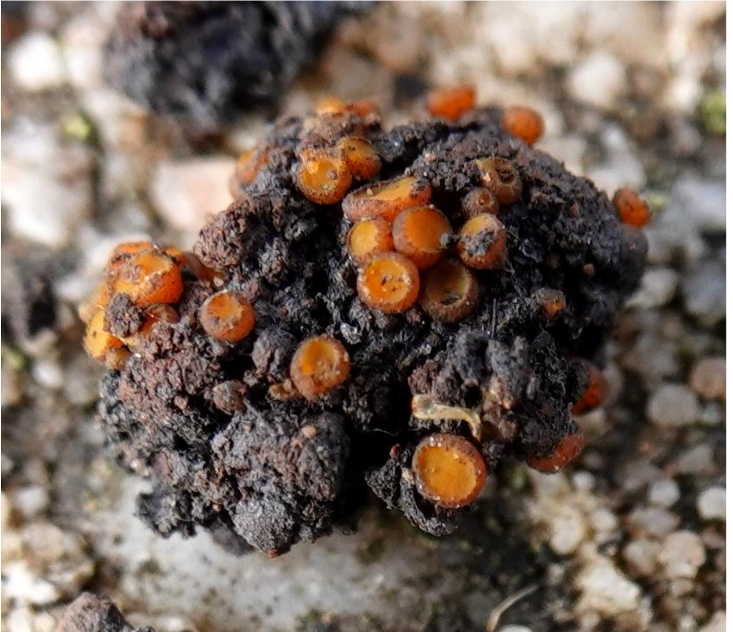
Anthracobia melaloma (Alb. & Schwein.) Arnould, 1893 Pezizales - Pyronemataceae

“Champignons observés sur une place à feu”