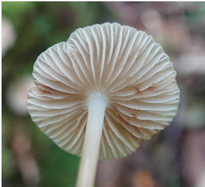
Mycena galericulata (Scop.) Gray, 1821 Mycène casquée - Tricholomatales - Mycenaceae