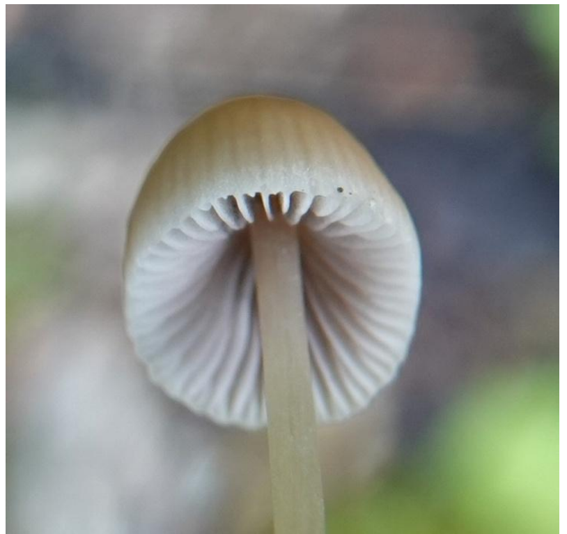
Psathyrella corrugis (Pers.) Konrad & Maubl., 1949 Agaricales - Psathyrellaceae