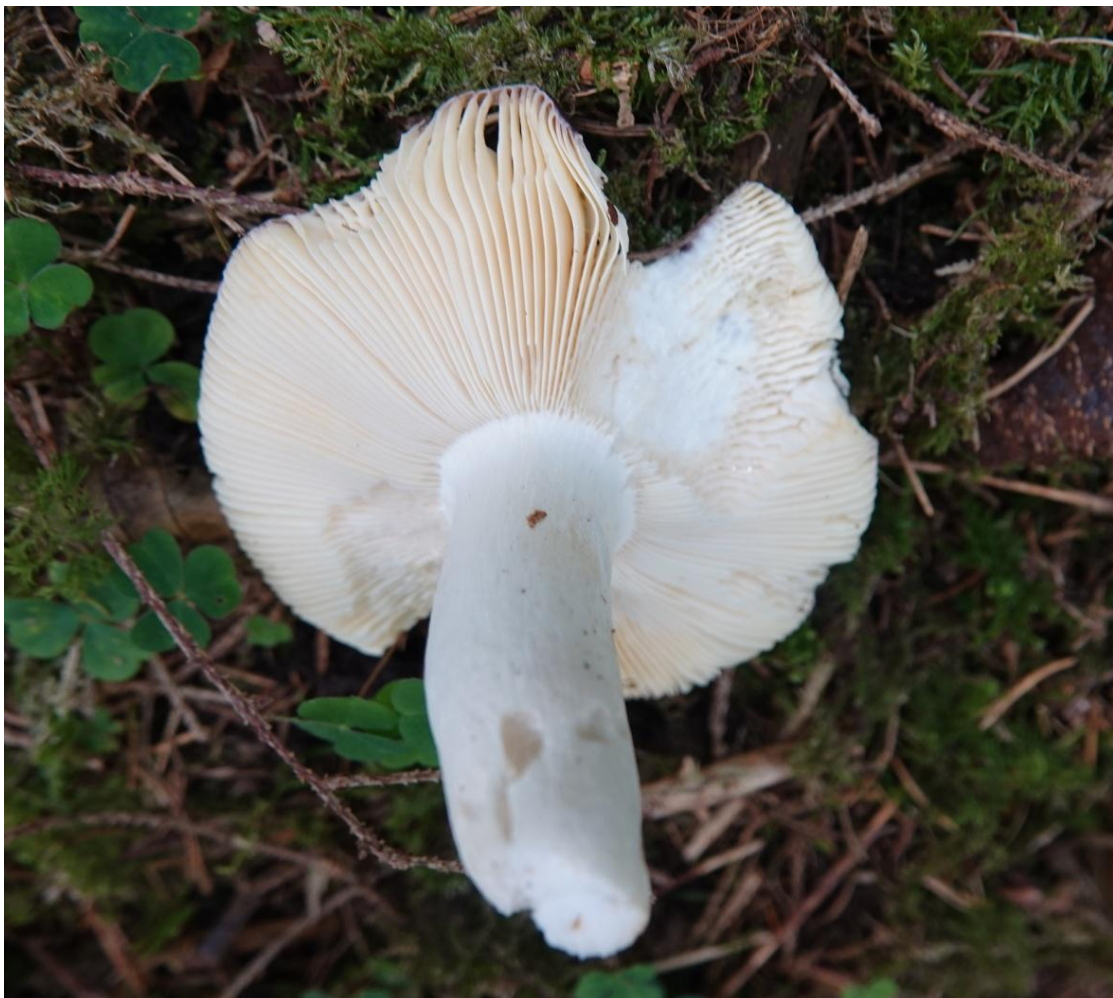
Russula integra (L.) Fr., 1838 Russule des épicéas - Russulales - Russulaceae