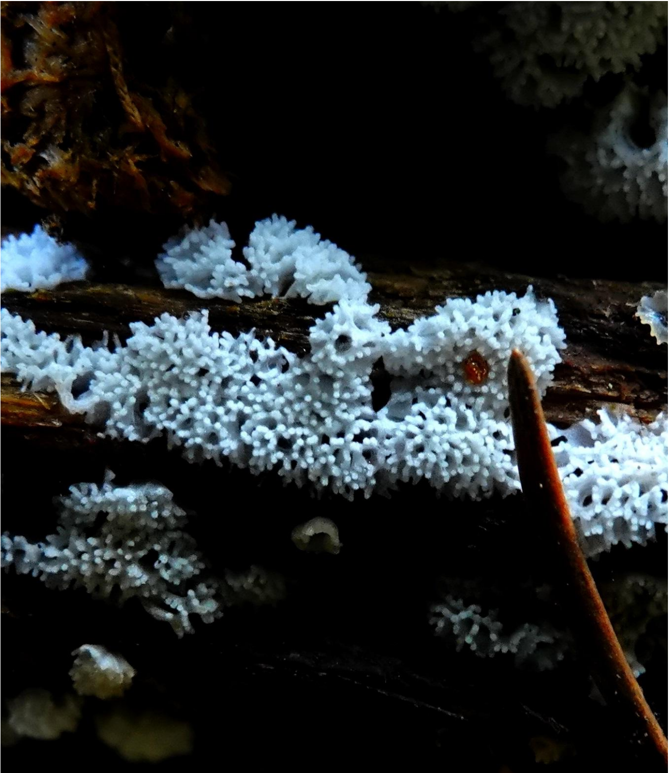
Ceratiomyxa fruticulosa (O. F. Müll.) T. Macbr., 1899 Protosteliales - Ceratiomyxaceae

(Myxomycète observé et déterminé par Philippe Defranoux)