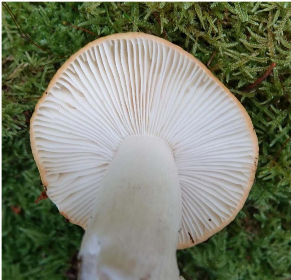
Russula ochroleuca Pers. Russule ocre et blanche - Russulales - Russulaceae