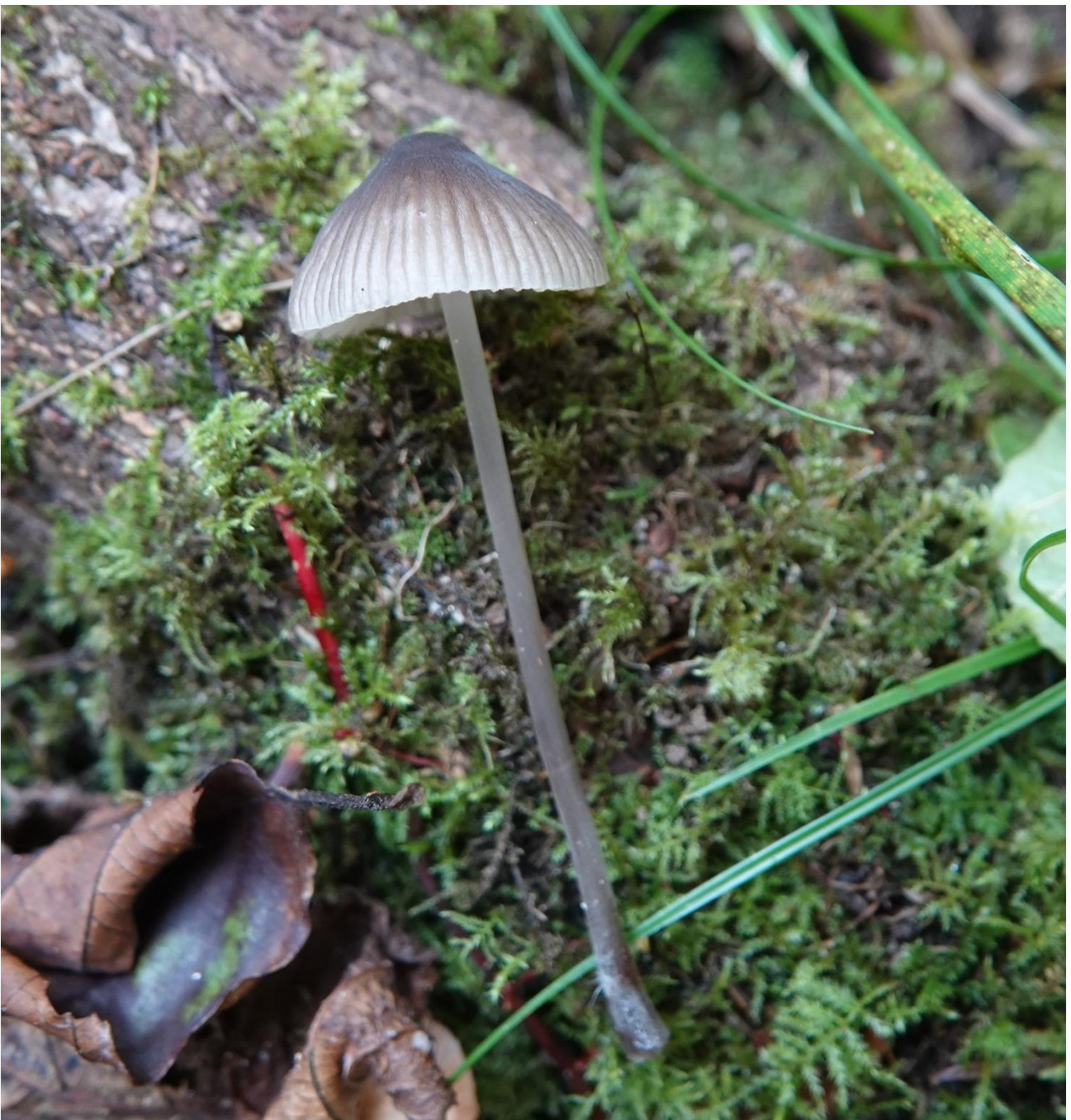
Mycena leptcephala (Pers.) Gillet, 1876 Mycène chlorée - Mycène à chair mince - Tricholomatales - Mycenaceae