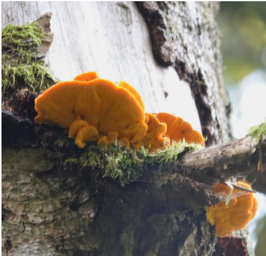
Pycnoporellus fulgens (Fr.) Donk, 1971 Polypore flamboyant - Polyporales - Polyporaceae