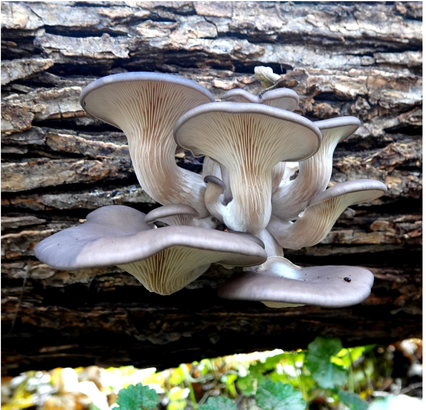
Pleurotus ostreatus (Jacq.) P. Kumm., 1871 Pleurote en huître - Tricholomatales - Pleurotaceae