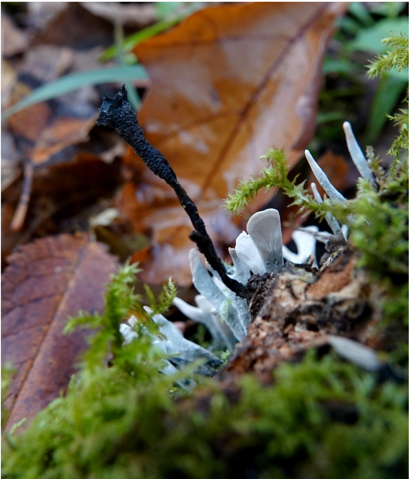
Xylaria hypoxylon (L.) Grev., 1824 Xylaire du bois - Xylariales - Xylariaceae