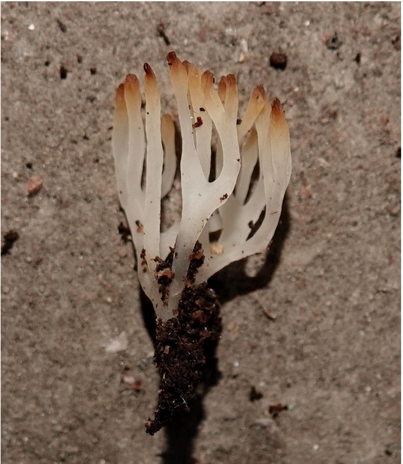
Lentaria subcaulescens (Rebent.) Rauschert, 1987 Gomphales - Gomphaceae