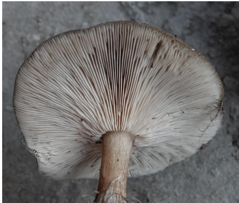
Melanoleuca decembris Métrod ex Bon, 1986 Melanoleuca hivernal - Agaricales - Tricholomataceae