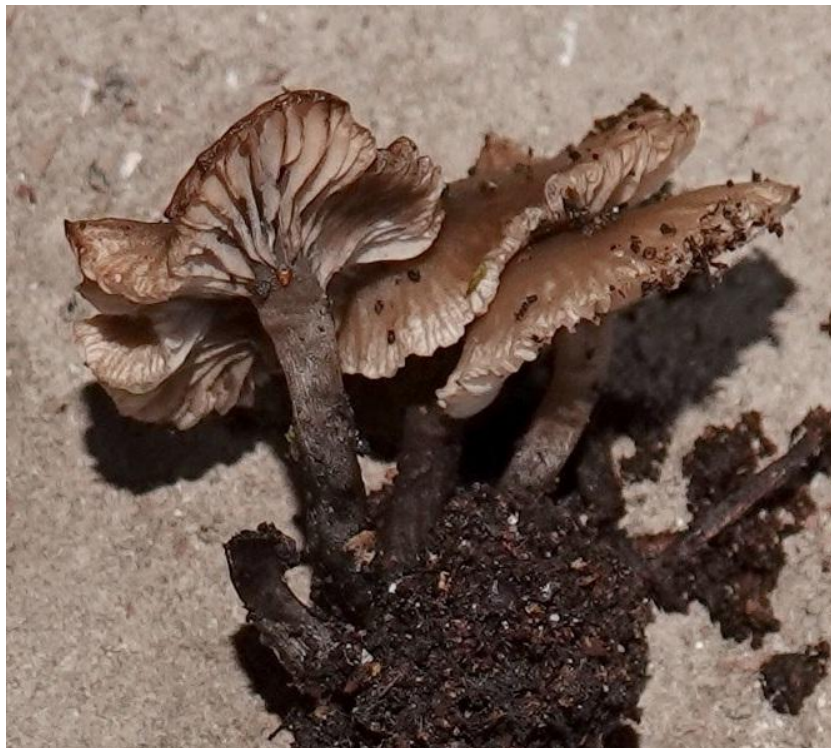
Lyophyllum osmophorum (E.-J. Gilbert) E. Ludwig, 2001 Tricholomatales - Lyophyllaceae

« Connu à ce jour que de Bettlach (Musumeci) »