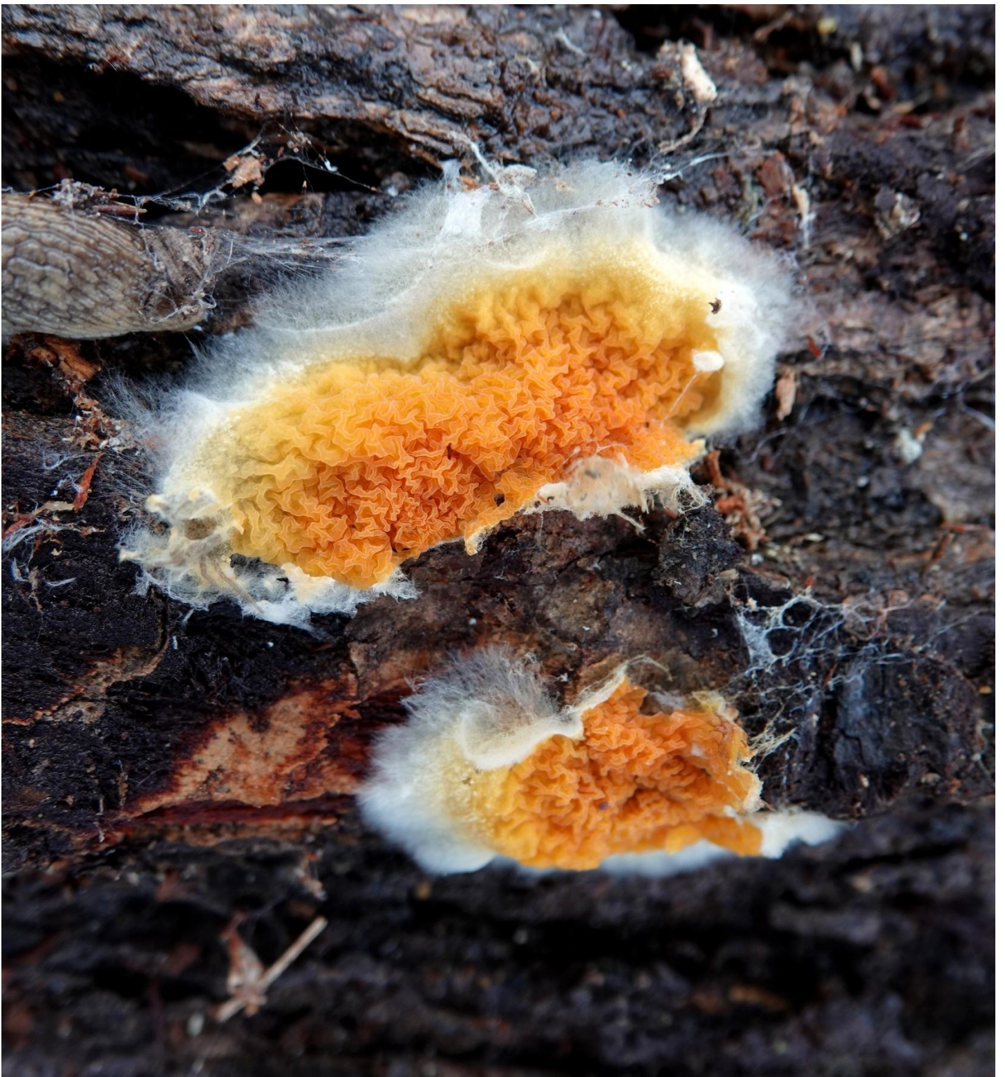
Leucogyrophana pseudomollusca (Parmasto) Parmasto, 1967 Boletales - Coniophoraceae