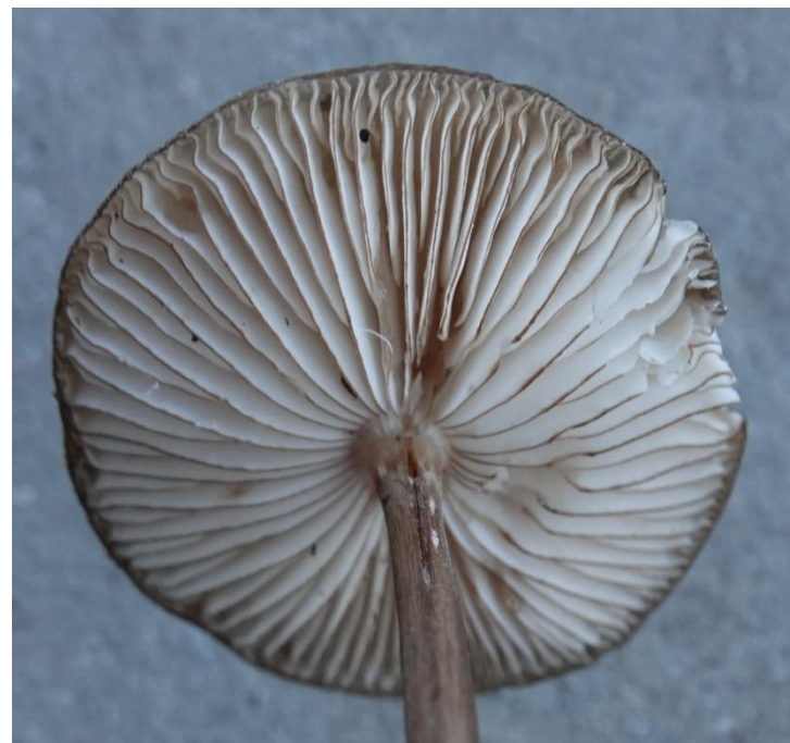
Oudemansiella radicata var. marginata (Konrad & Maublanc) M. Bon & Dennis Collybie radicante - Tricholomatales - Physalacriaceae