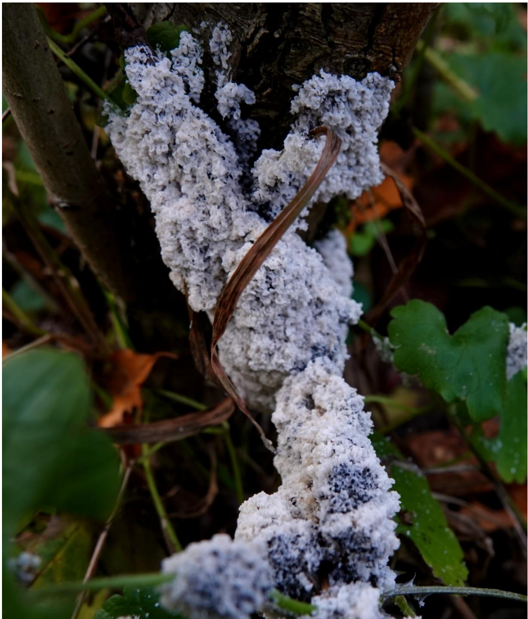
Mucilago crustacea P. Micheli ex F. H. Wigg., 1780 Physarales - Didymiaceae