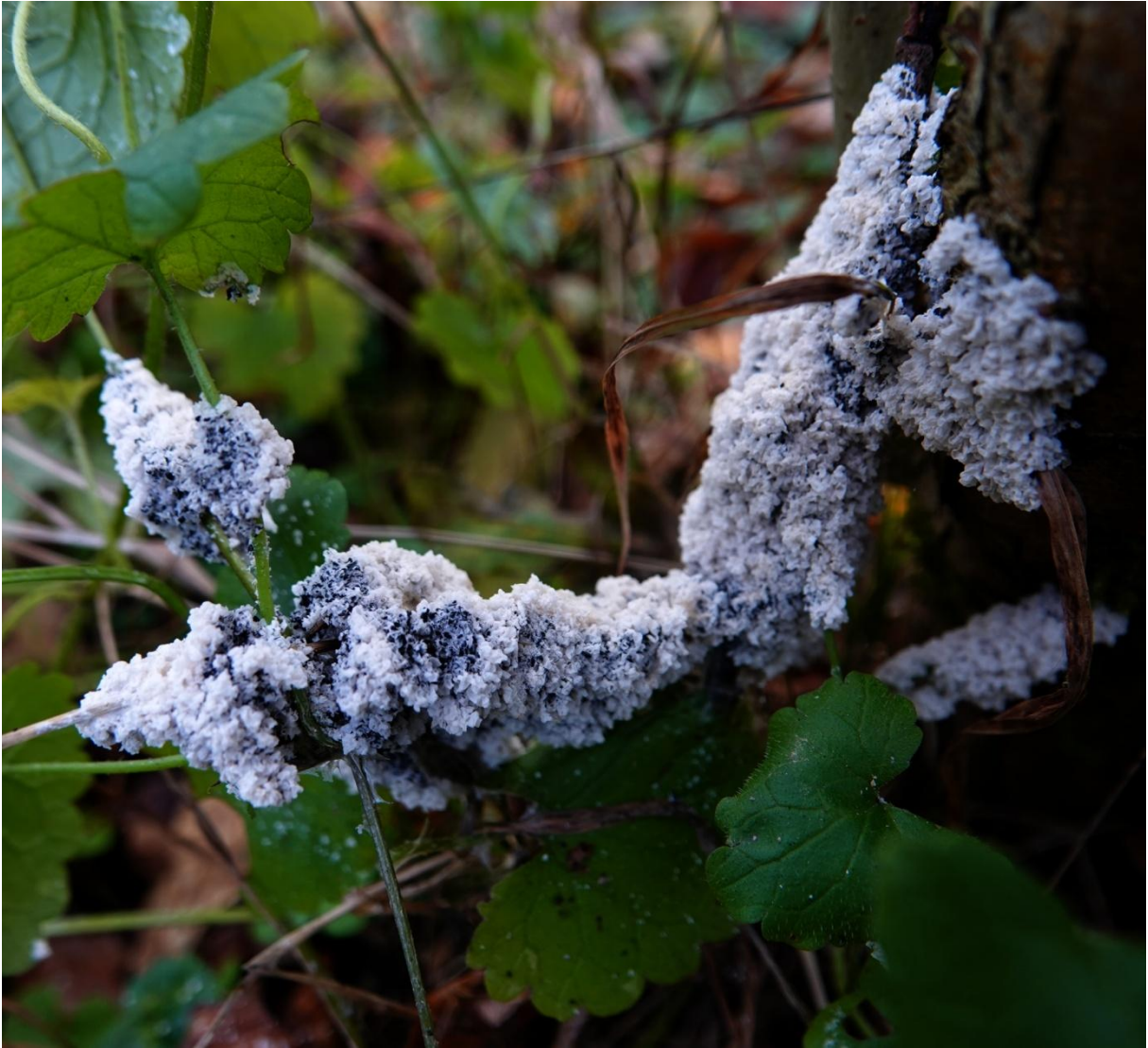
Mucilago crustacea P. Micheli ex F. H. Wigg., 1780 Physarales - Didymiaceae