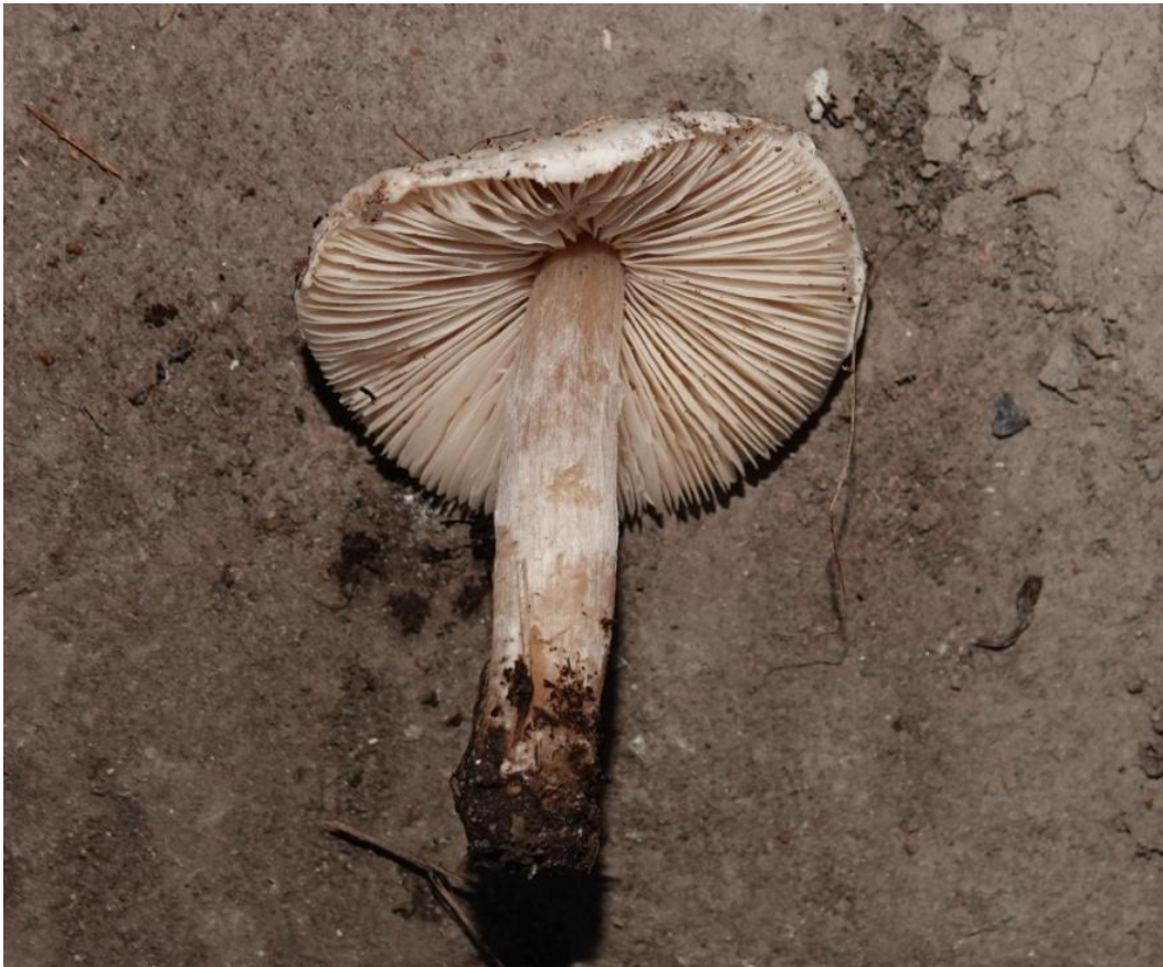
Lepiota alba (Bres.) Sacc., 1887 - Agaricales - Agaricaceae