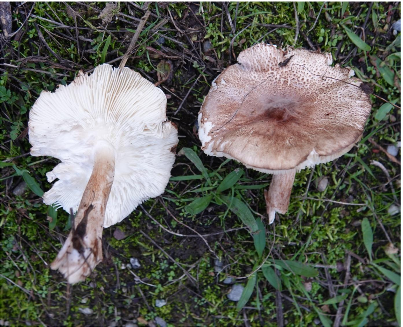
Leucoagaricus pilatianus (Demoulin) Bon & Boiffard, 1976 Lépiote de Pilát - Agaricales - Secotiaceae