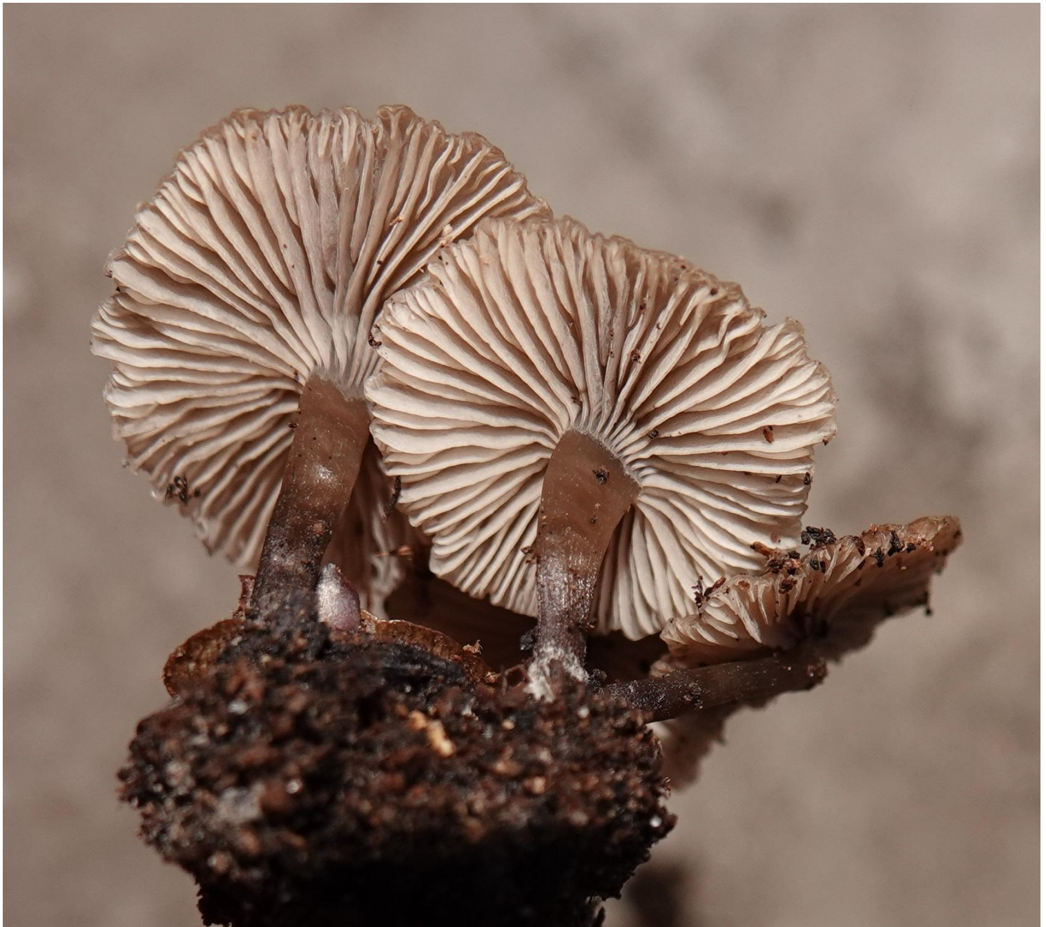
Lyophyllum osmophorum (E.-J. Gilbert) E. Ludwig, 2001 Tricholomatales - Lyophyllaceae