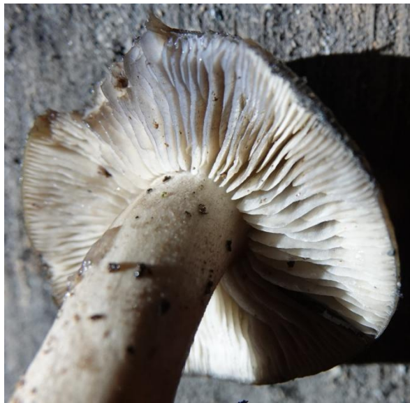
Lyophyllum transforme (Sacc.) Singer, 1943 Tricholome à spores triangulaires - Tricholomatales - Lyophyllaceae