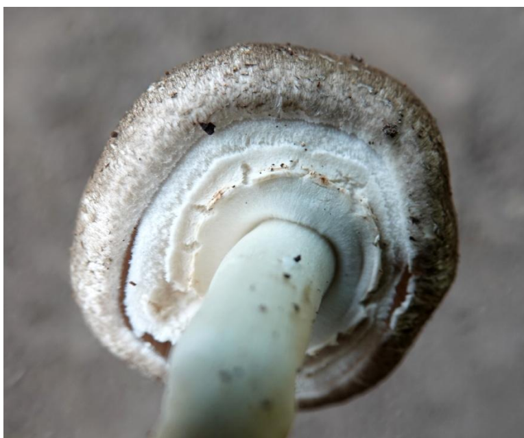
Agaricus praeclaresquamosus A.E. Freeman (1979) Agaricales - Agaricaceae