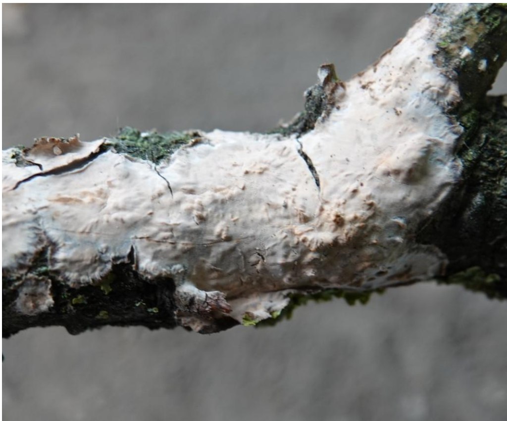
Peniophora quercina (Pers.) Cooke, 1879 - Hericiales - Peniophoraceae

Paxille enroulé - Paxille à bords enroulés - Paxille involuté - Bolet à lamelles Chanterelle brune - Boletales - Paxillaceae