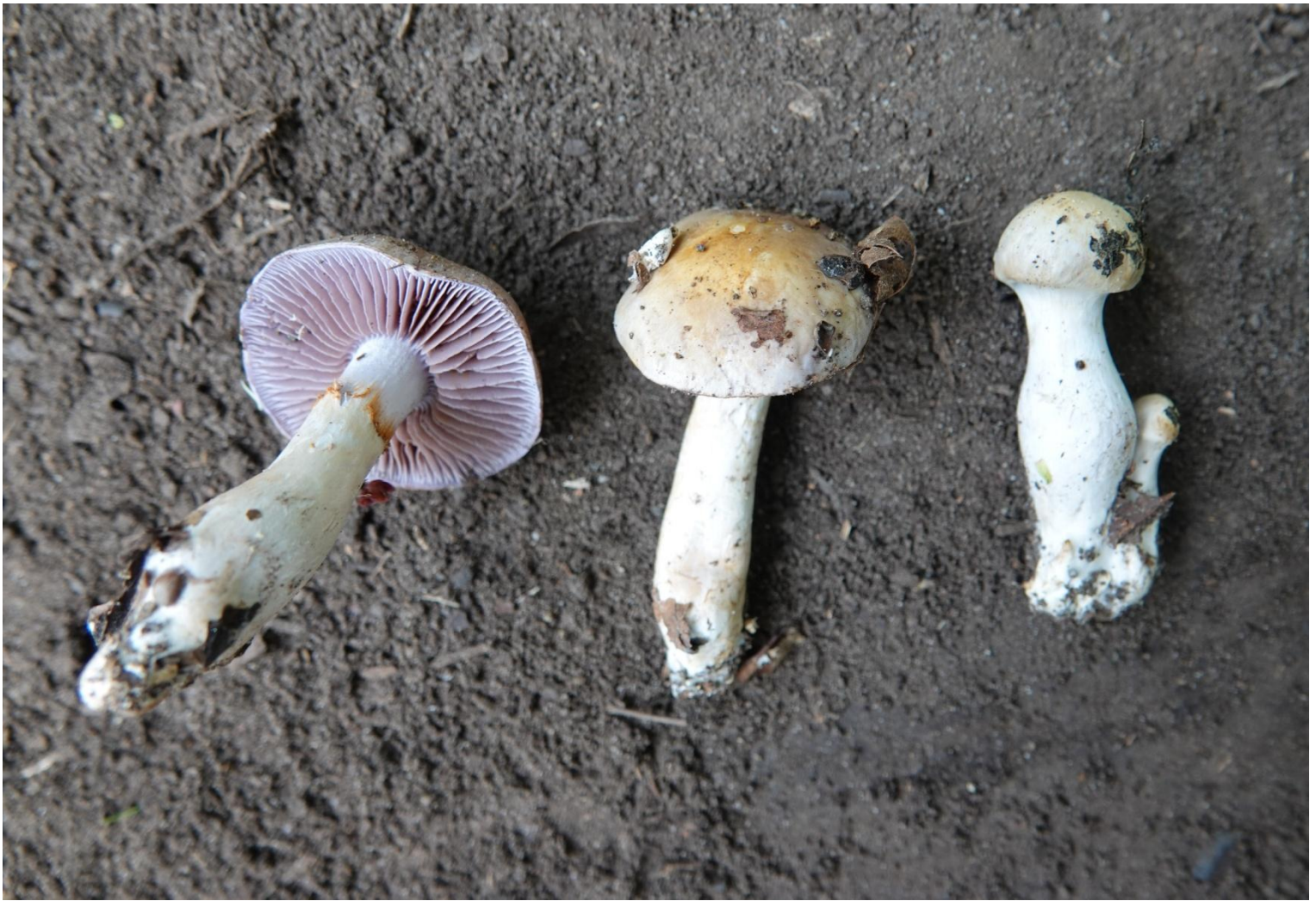
Cortinarius salor Fr., 1838 Cortinaire couleur de mer - Agaricales - Cortinariaceae