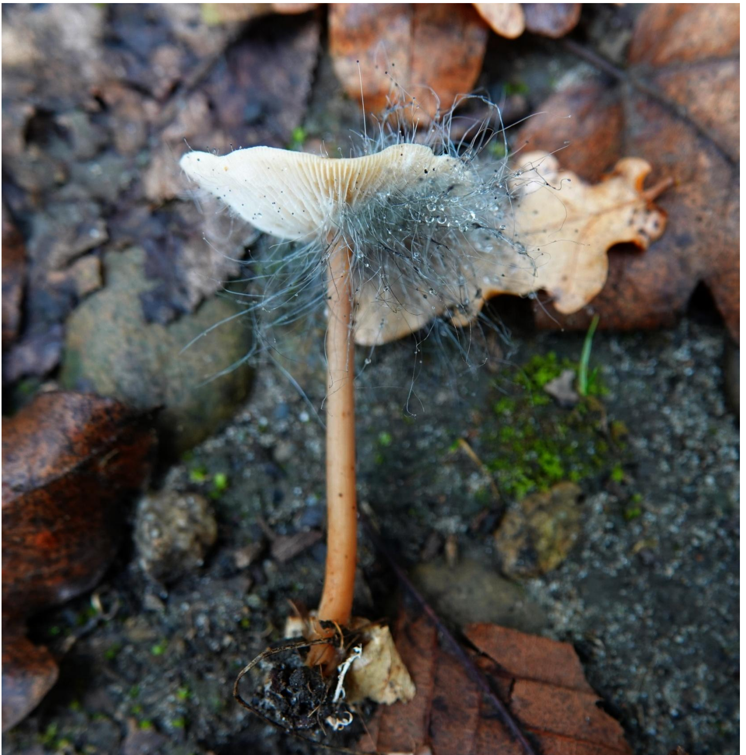
Spinellus fusiger (Link) Tiegh., 1875 Spinelle fusiger - Mucorales - Phycomycetaceae