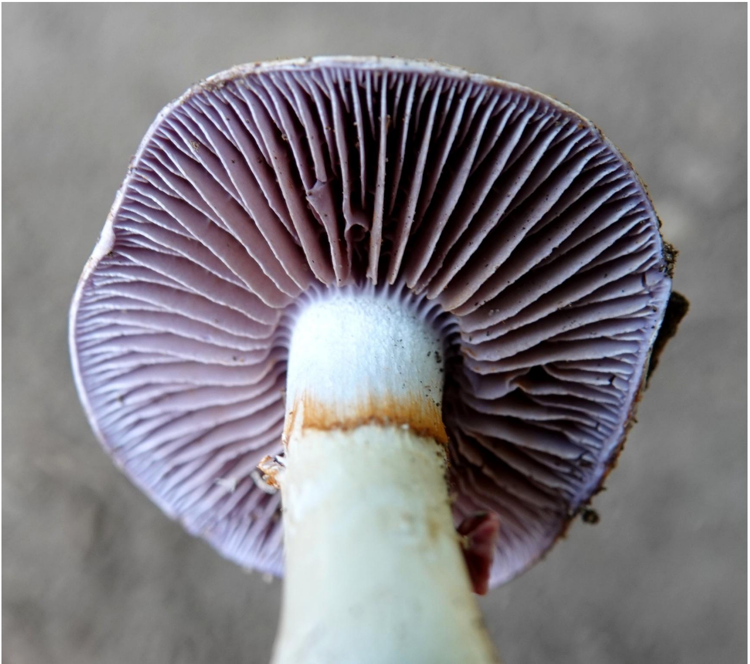
Cortinarius salor Fr., 1838 Cortinaire couleur de mer - Agaricales - Cortinariaceae