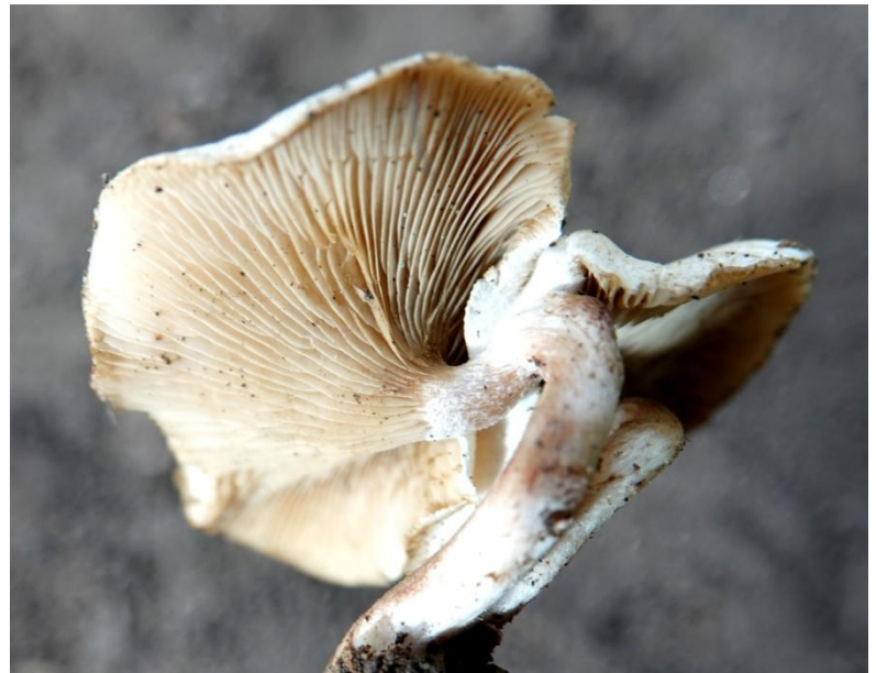
Ripartites metrodii Huijsman, 1960 Ripartite de Métrod - Agaricales - Tricholomataceae