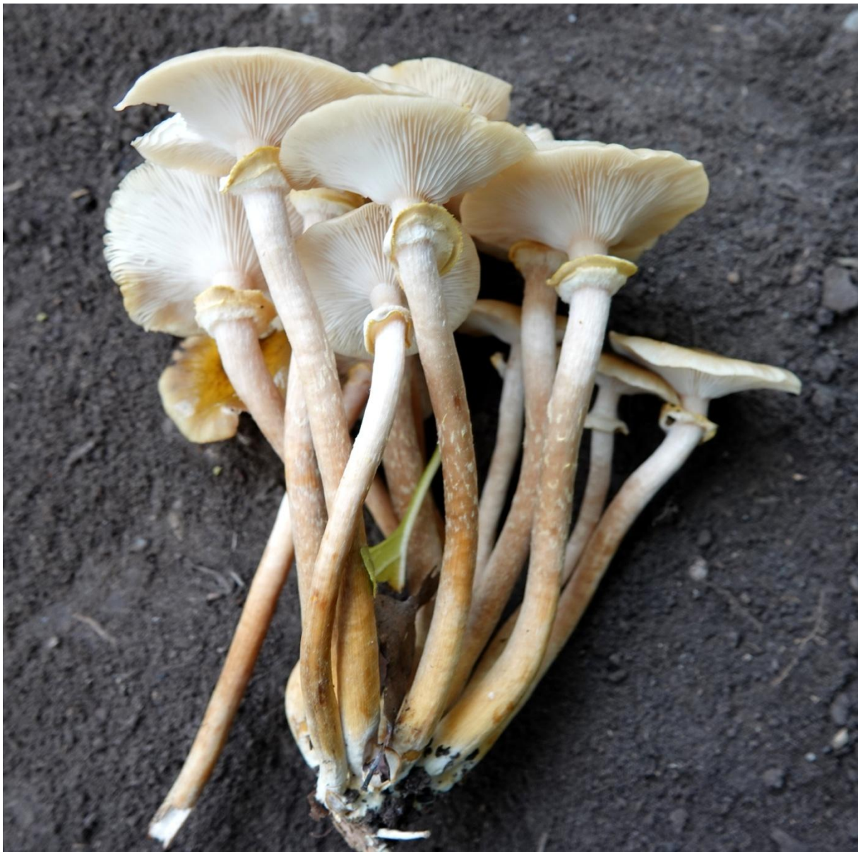
Armillaria mellea (Vahl) P. Kumm., 1871 Armillaire couleur de miel - Armillaire des feuillus Agaricales - Tricholomataceae