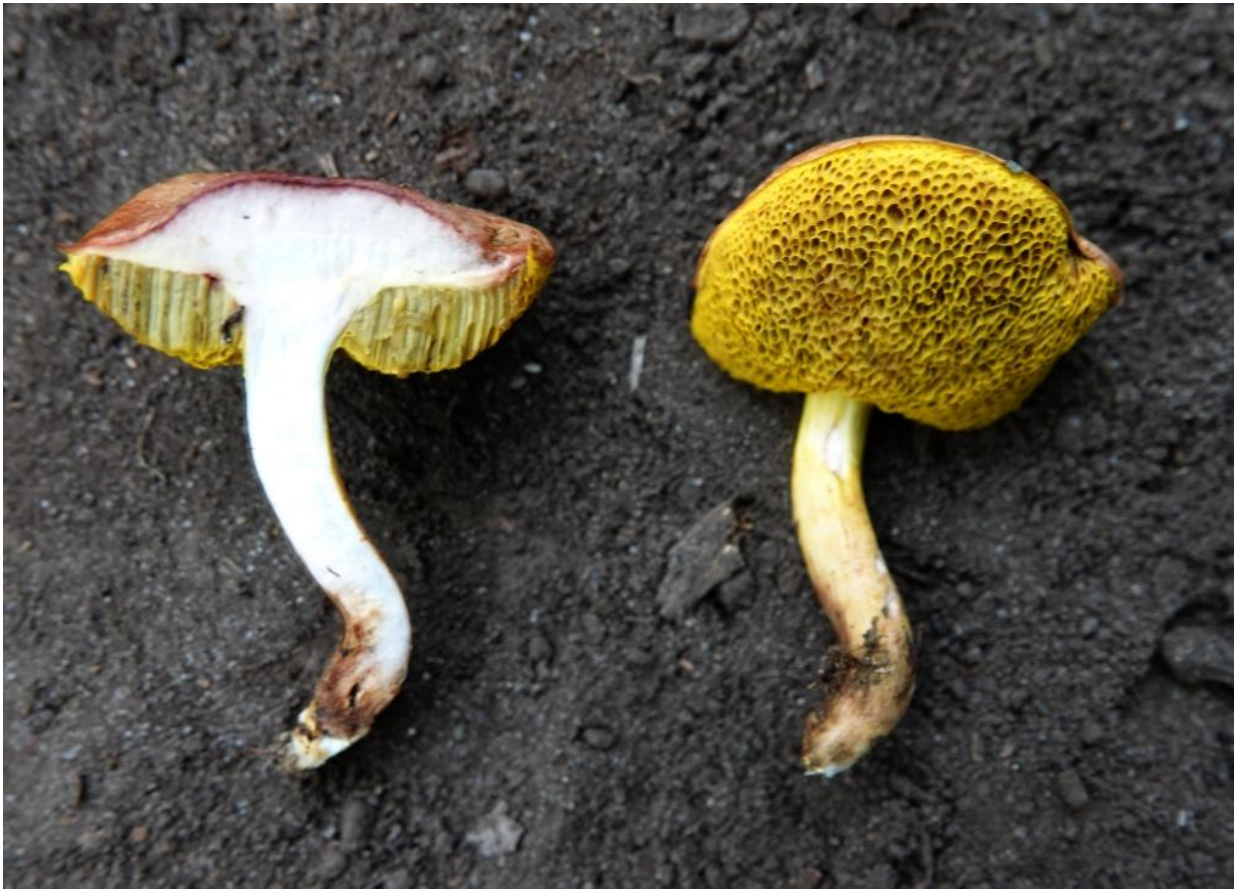
Aureoboletus rubellus J.Y. Fang, G. Wu & K. Zhao 2019 Boletales - Boletaceae