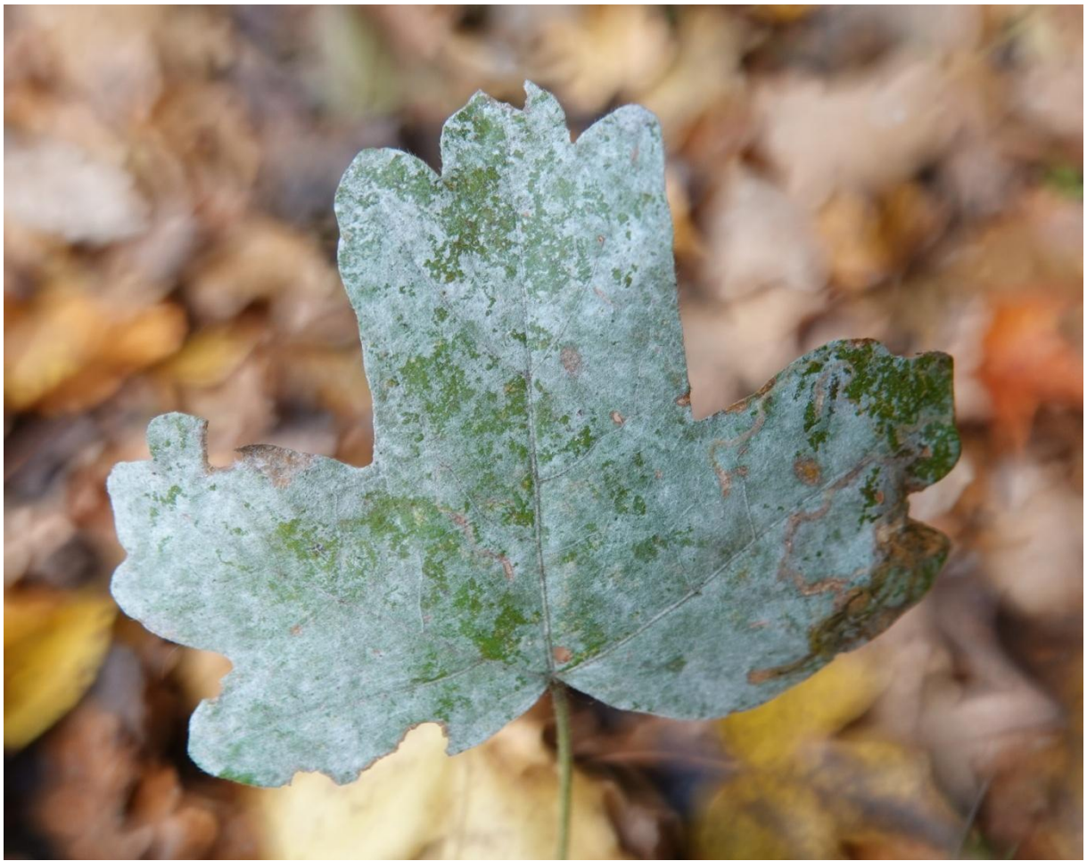
Sawadaea bicornis (Wallr.) Homma, 1937 - Erysiphales - Erysiphaceae