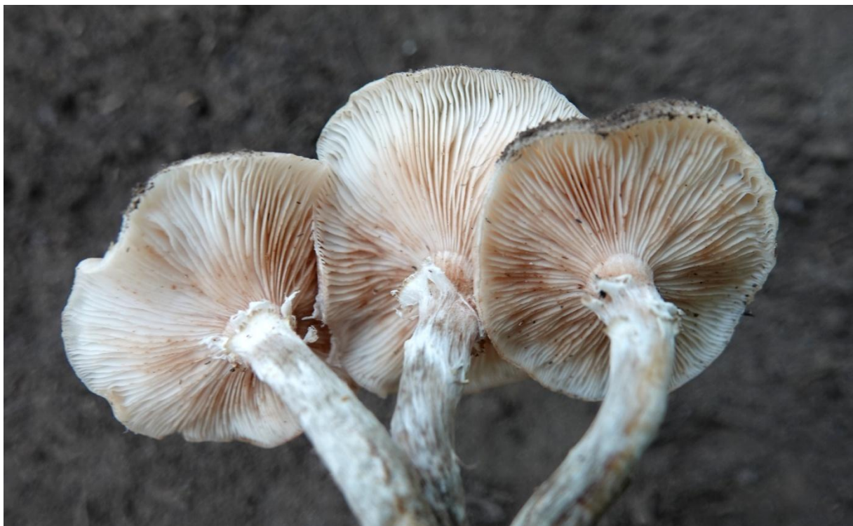
Armillaria cepistipes Velen., 1920 Armillaire pied-bot - Agaricales - Tricholomataceae