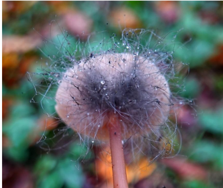
Spinellus fusiger (Link) Tiegh., 1875 Spinelle fusiger - Mucorales - Phycomycetaceae