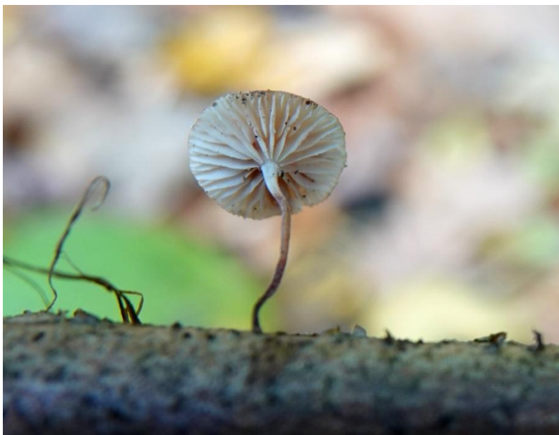
Marasmiellus ramealis (Bull.) Singer, 1948 Marasme des rameaux - Tricholomatales - Marasmiaceae