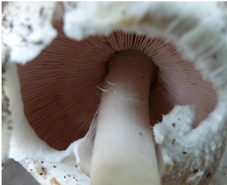
Agaricus xanthodermus Genev., 1876 Agaric (psalliote) jaunissant - Agaricales - Agaricaceae