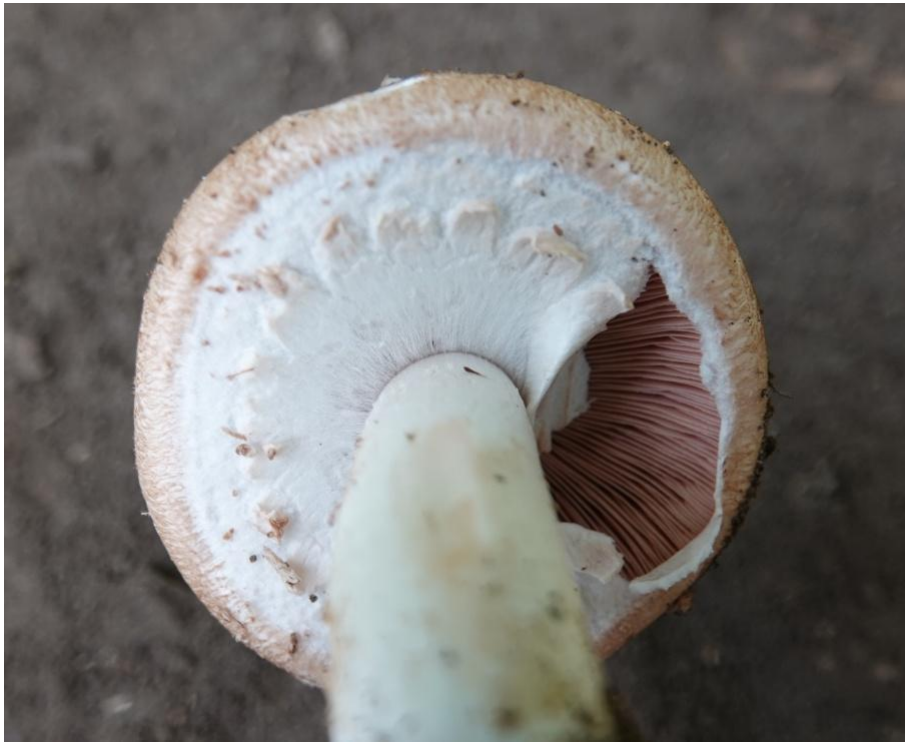
Agaricus sylvaticus Schaeff., 1774 Psalliote des bois - Agaric des forêts - Psalliote des forêts Agaricales - Agaricaceae