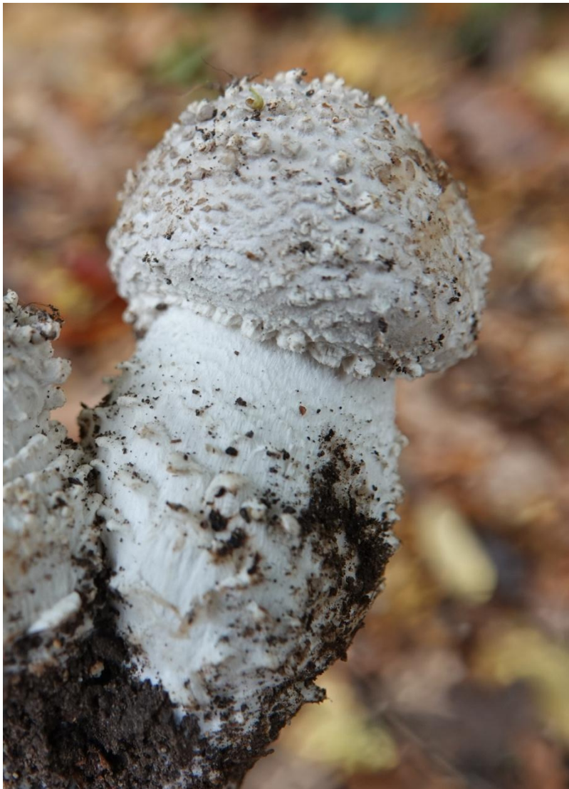
Amanita echinocephala (Vittad.) Quél., 1872 Amanite épineuse - Amanitales - Amanitaceae