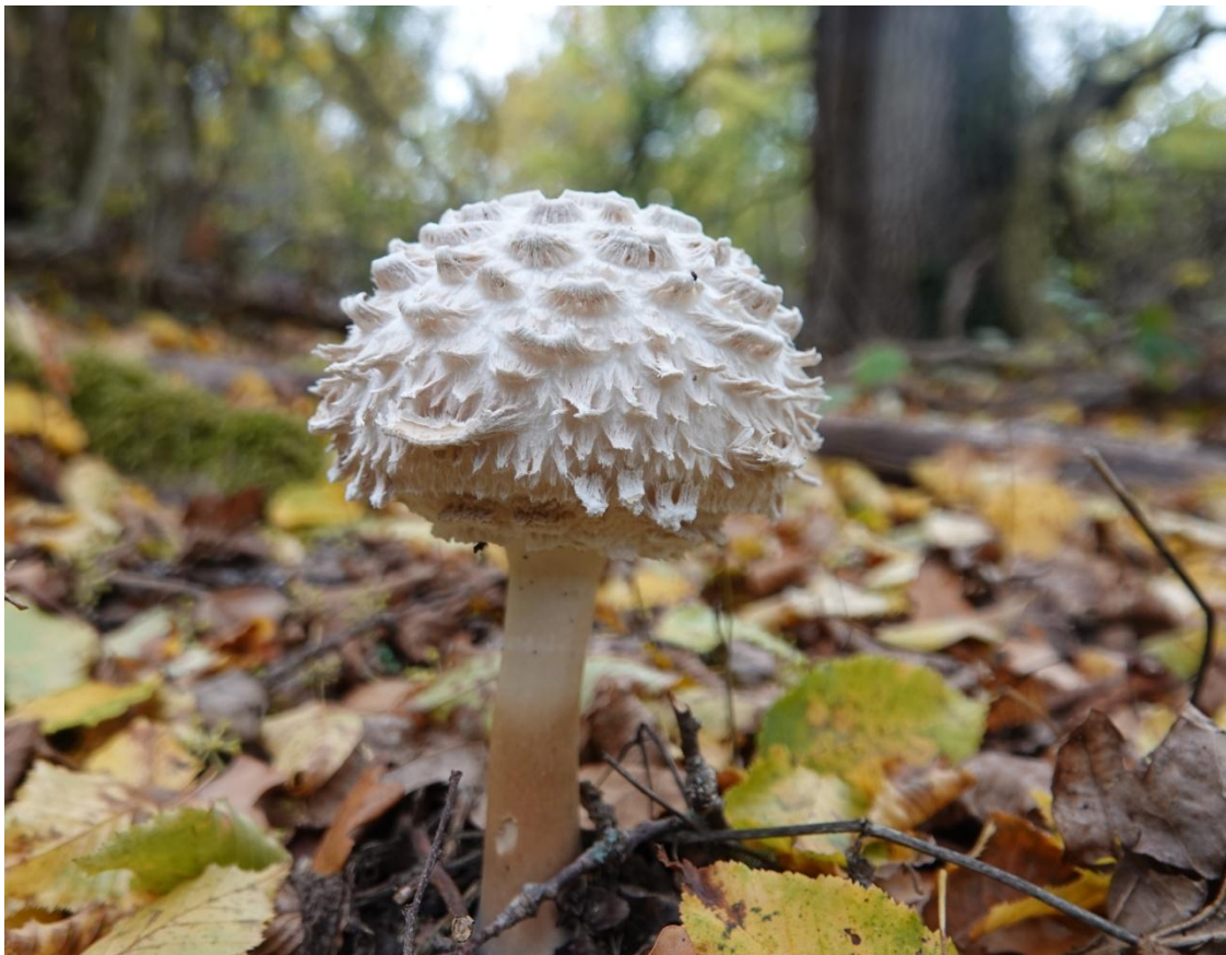
Chlorophyllum rhacodes (Vittad.) Vellinga, 2002 (INPN) Synonyme : Lepiota rhacodes (Vittad.) Quél., 1872 Lépiote déguenillée - Agaricales - Agaricaceae