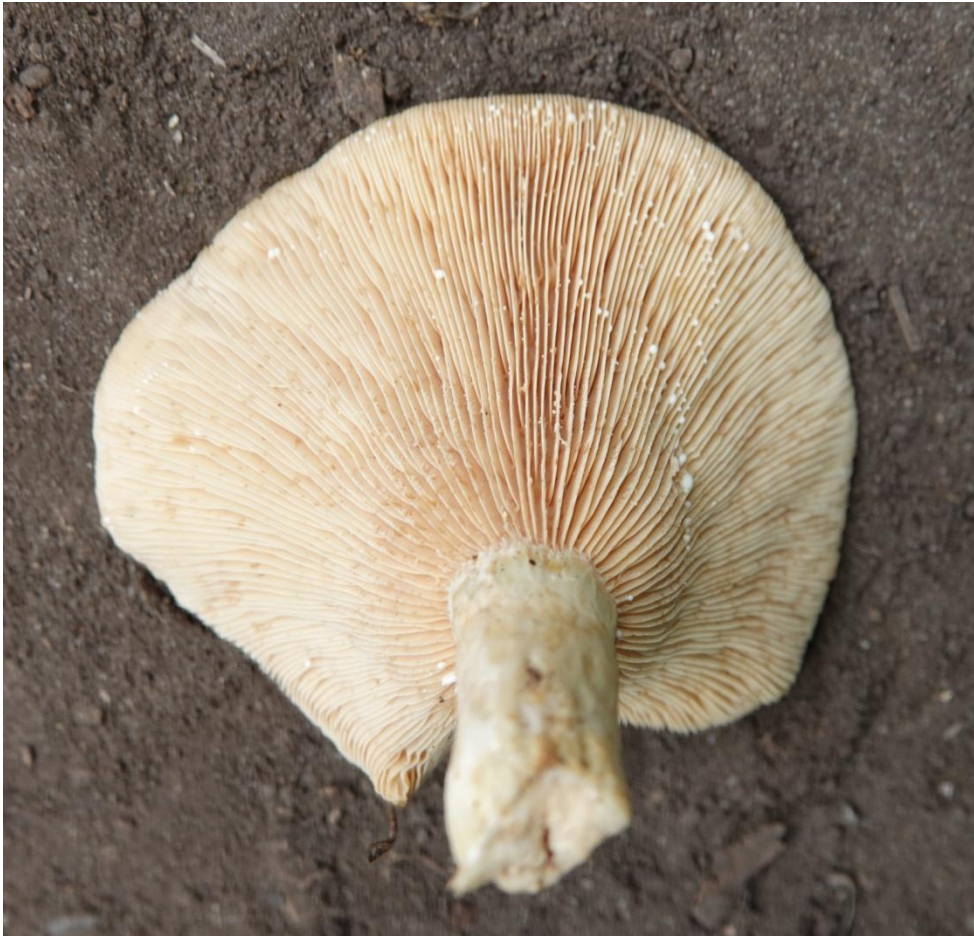
Lactarius zonarius (Bull.) Fr., 1838 Lactaire zoné - Russulales - Russulaceae