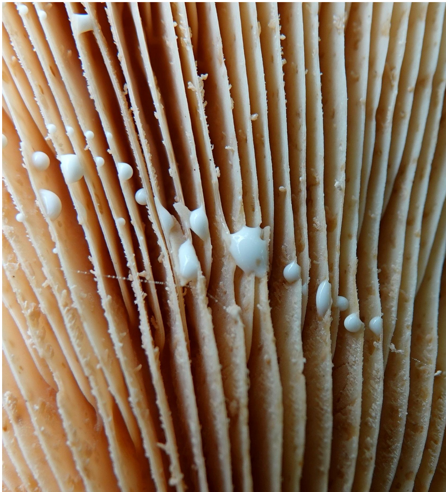
Lactarius zonarius (Bull.) Fr., 1838 Lactaire zoné - Russulales - Russulaceae