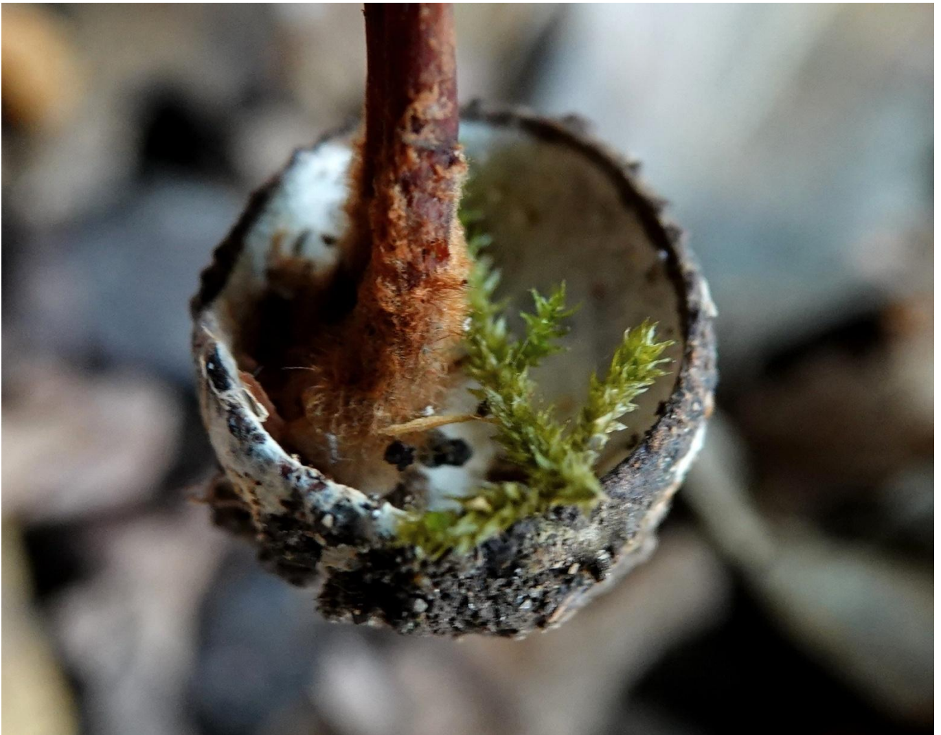
Collybia erythropus (Pers.) P. Kumm., 1871 Synonyme : Collybia kuehneriana Singer, 1961 Collybie à pied rouge - Tricholomatales - Marasmiaceae