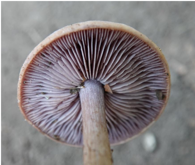
Lepista sordida (Schumach.) Singer, 1951 Petit pied bleu - Lépiste sordide - Agaricales - Tricholomataceae