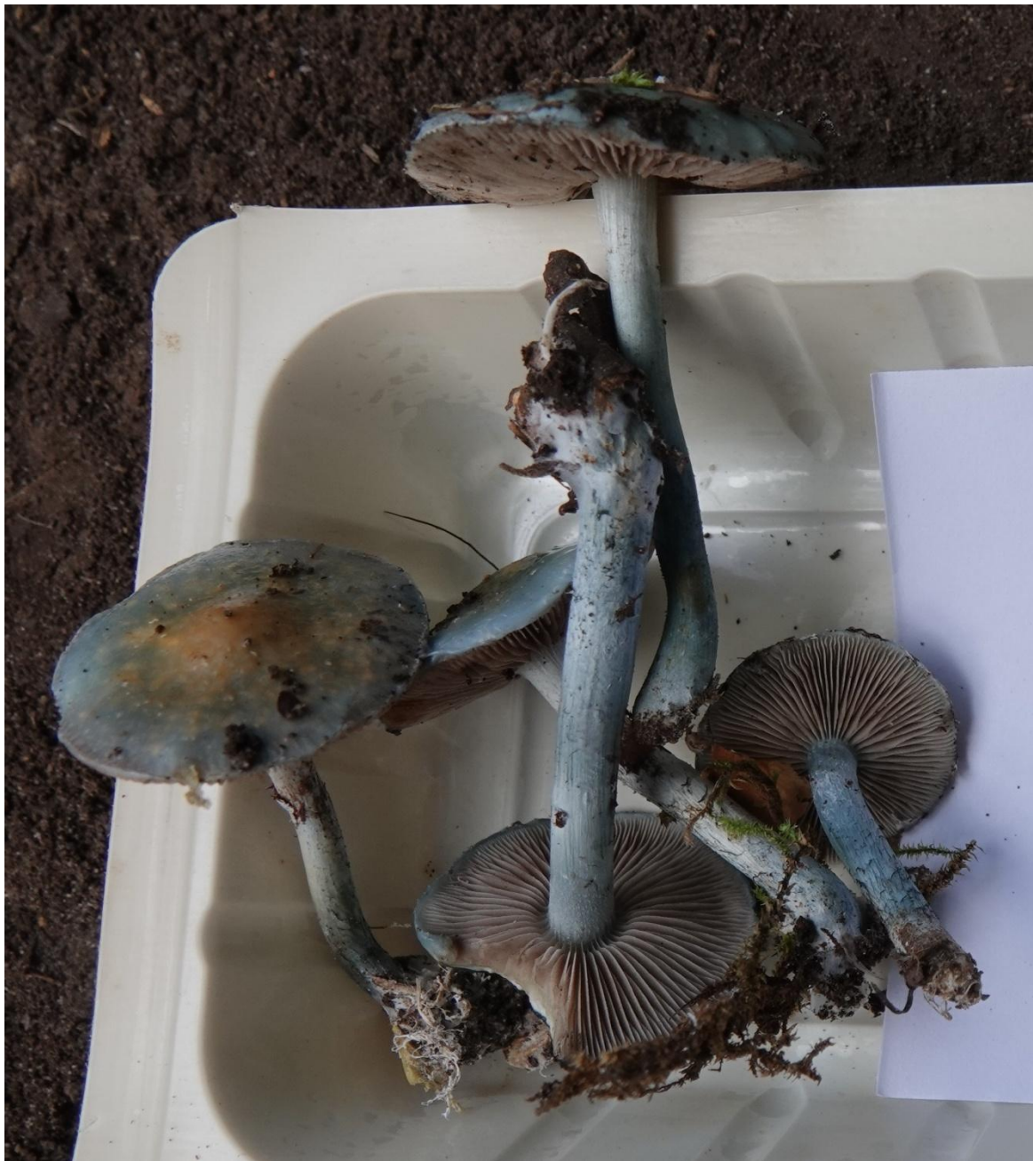
Stropharia caerulea Kreisel, 1979 Strophaire bleu - Agaricales - Strophariaceae