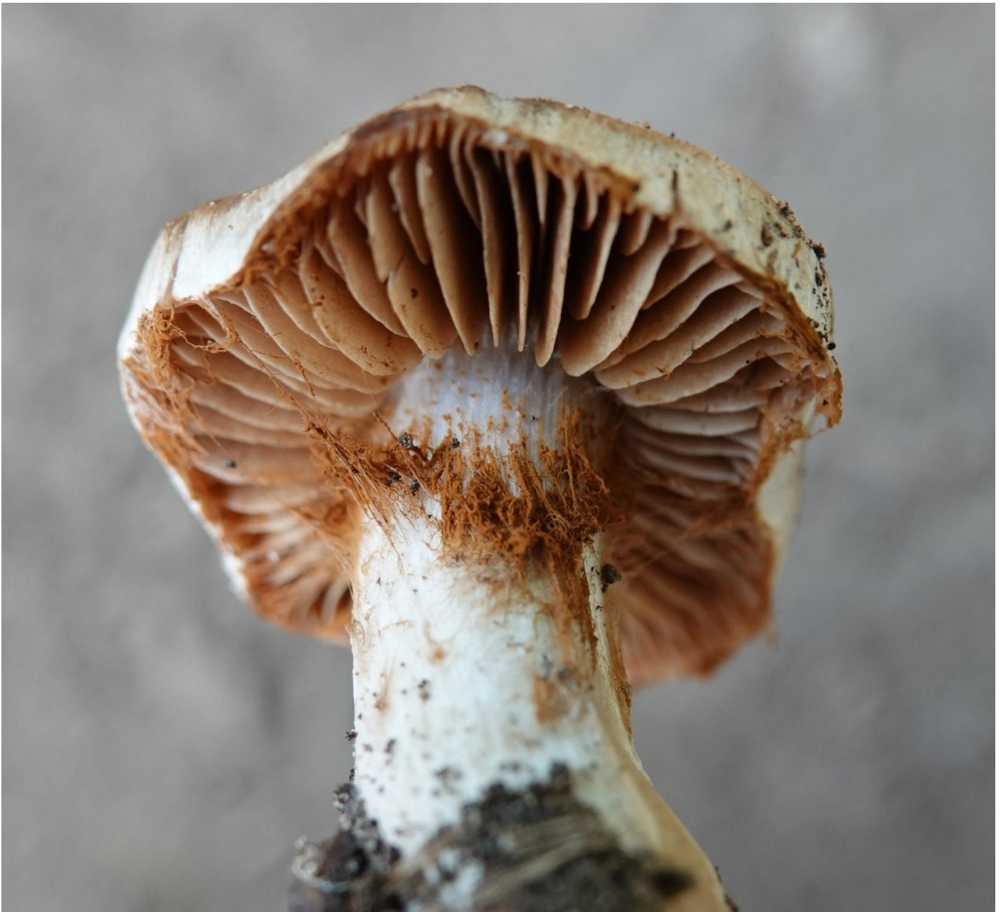
Cortinarius rubricosus (Fr.) Fr., 1838 - Agaricales - Cortinariaceae