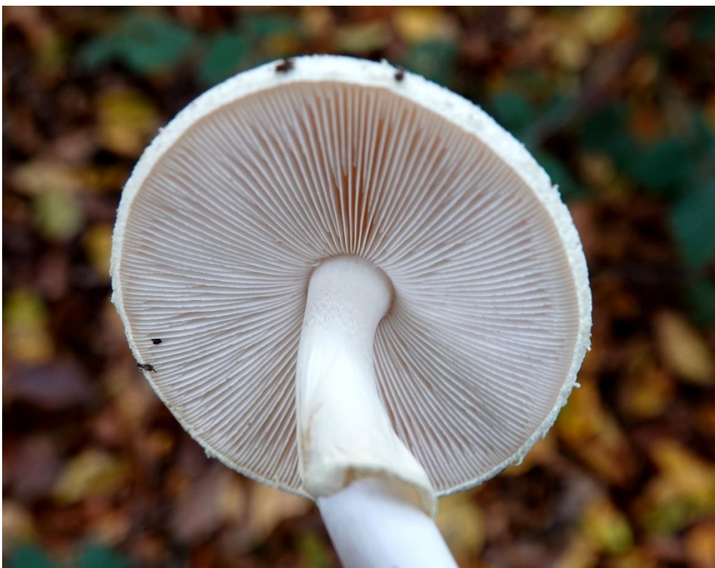
Amanita citrina Pers., 1797 - Amanite citrine - Amanitales - Amanitaceae