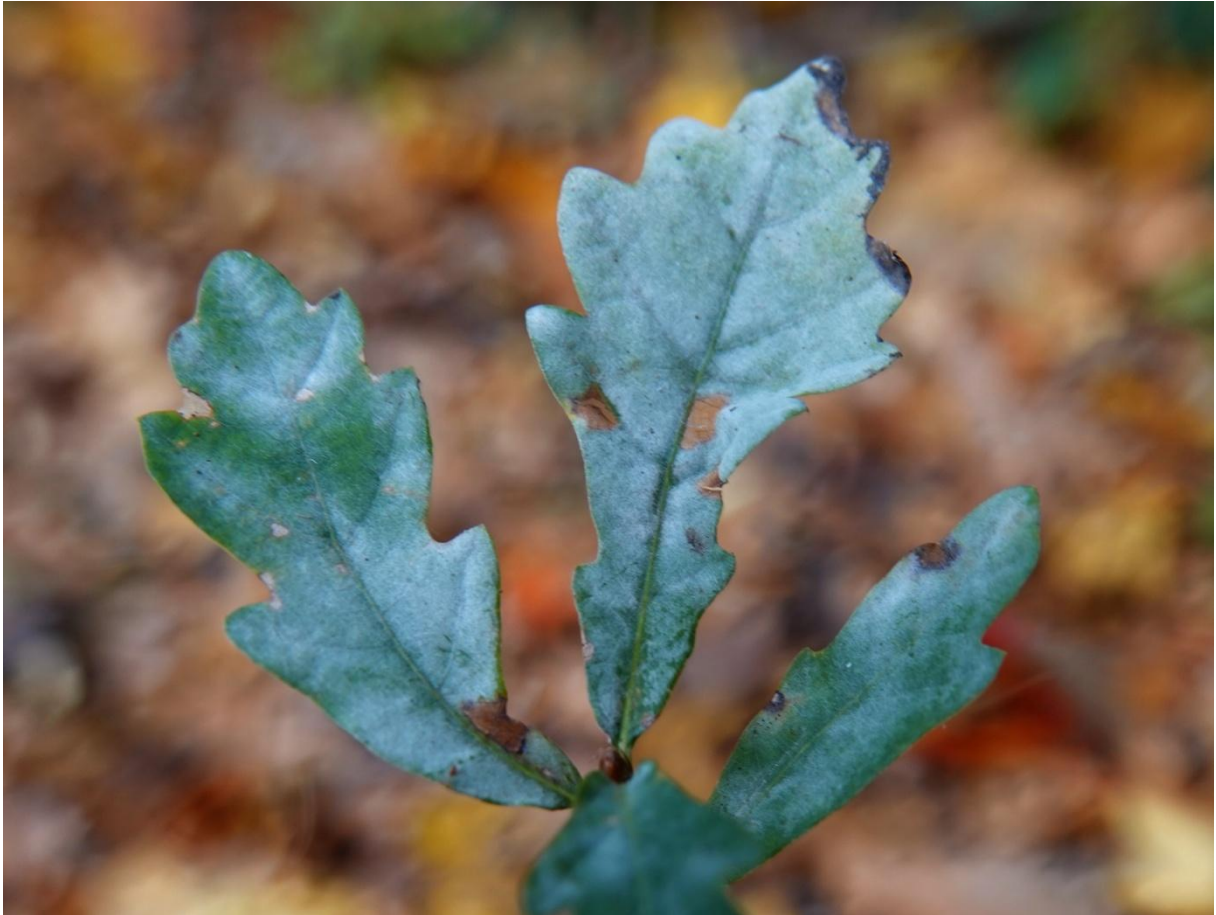
Erysiphe alphitoides (Griffon & Maubl.) U. Braun & S. Takam., 2000 Oïdium du chêne - Blanc du chêne - Erysiphales - Erysiphaceae