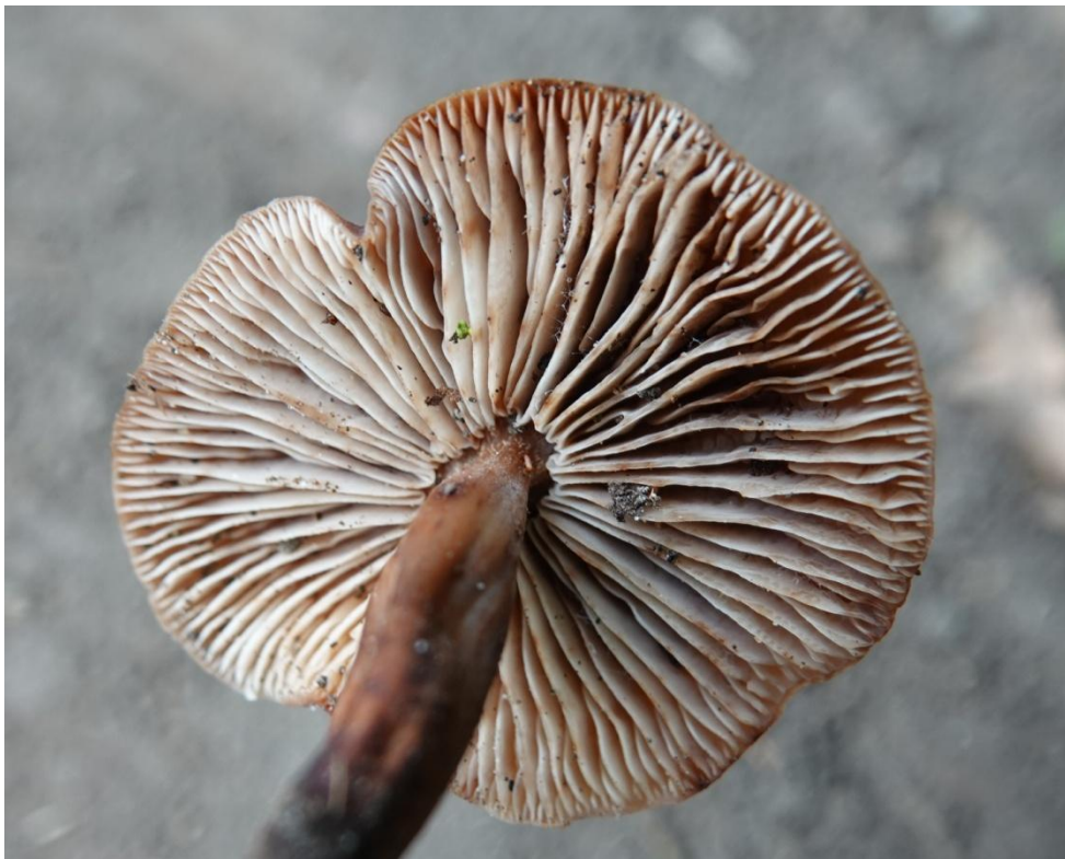
Collybia fusipes (Bull.) Quél., 1872 Souchette - Tricholomatales - Marasmiaceae