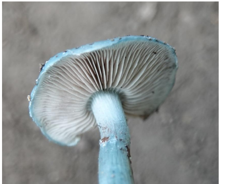
Stropharia caerulea Kreisel, 1979 Strophaire bleu - Agaricales - Strophariaceae