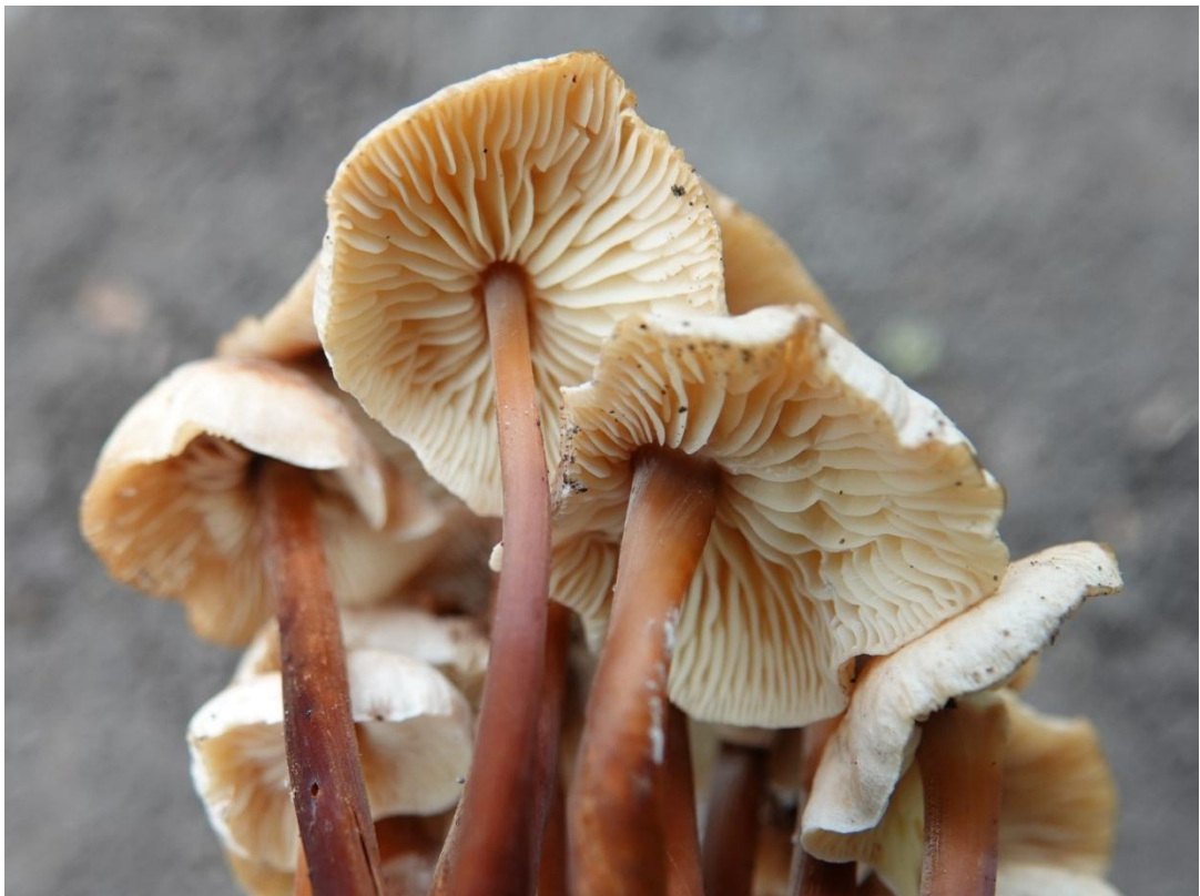
Collybia erythropus (Pers.) P. Kumm., 1871 Synonyme : Collybia kuehneriana Singer, 1961 Collybie à pied rouge - Tricholomatales - Marasmiaceae