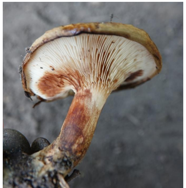
Paxillus involutus (Batsch) Fr., 1838

Paxille enroulé - Paxille à bords enroulés - Paxille involuté - Bolet à lamelles Chanterelle brune - Boletales - Paxillaceae