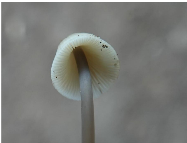
Mycena arcangeliana Bres., 1904 - Tricholomatales - Mycenaceae