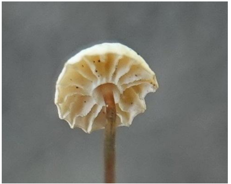
Marasmius rotula (Scop.) Fr., 1838 Marasme petite roue - Tricholomatales - Marasmiaceae