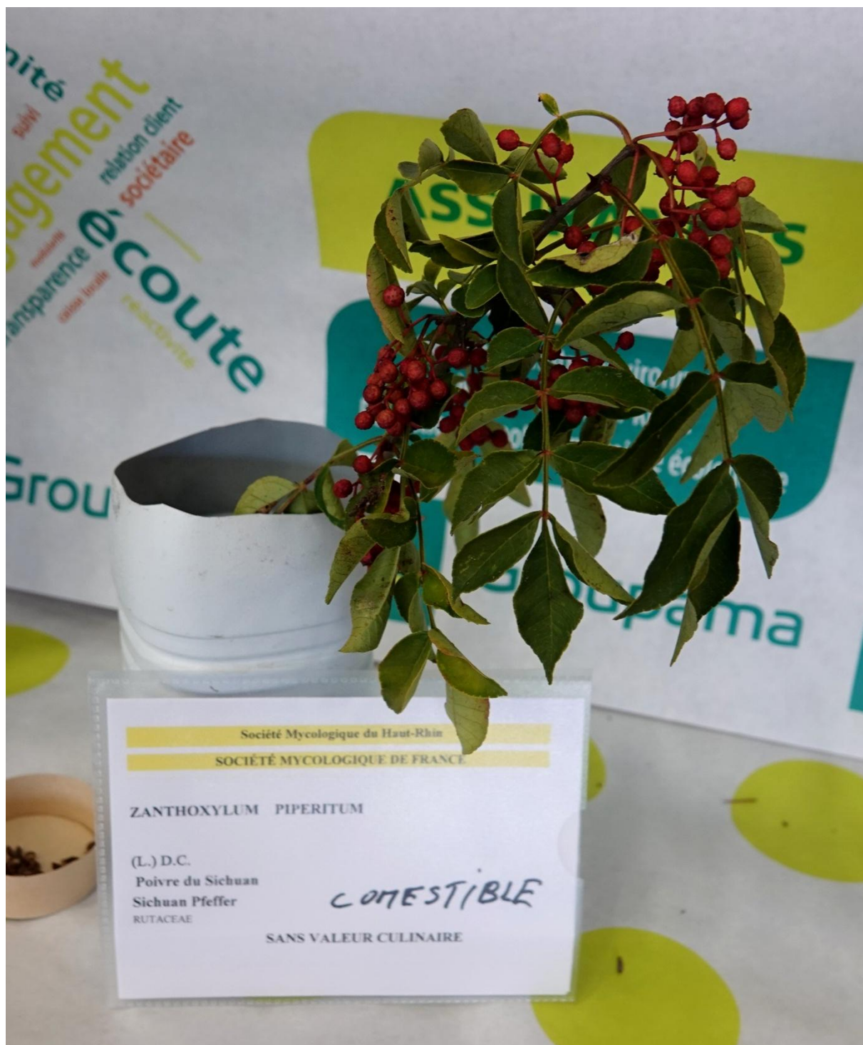
Zanthoxylum piperitum - Le poivre du Sichuan