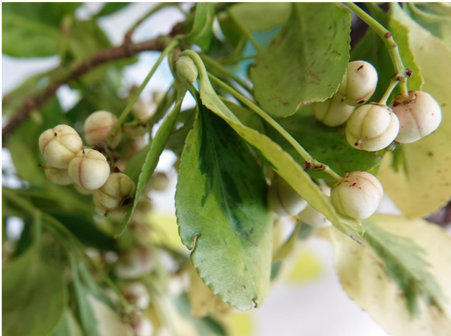
Euonymus japonicus L.f., 1780 Fusain du Japon - Celastrales - Celastraceae