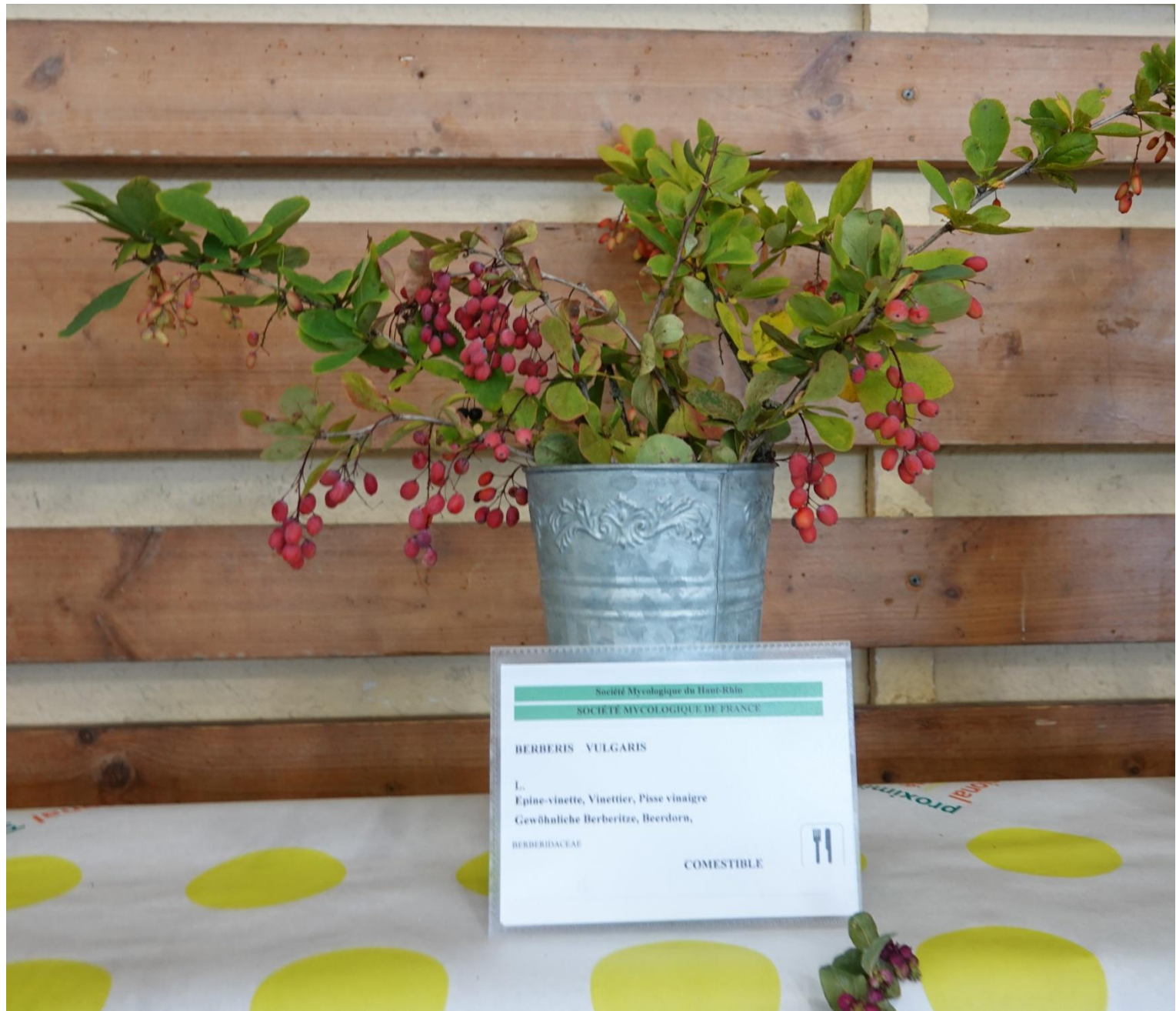
Berberis vulgaris L., 1753 Épine-vinette commune - Épine-vinette - Vinettier commun Berbéris commun - Ranunculales - Berberidaceae