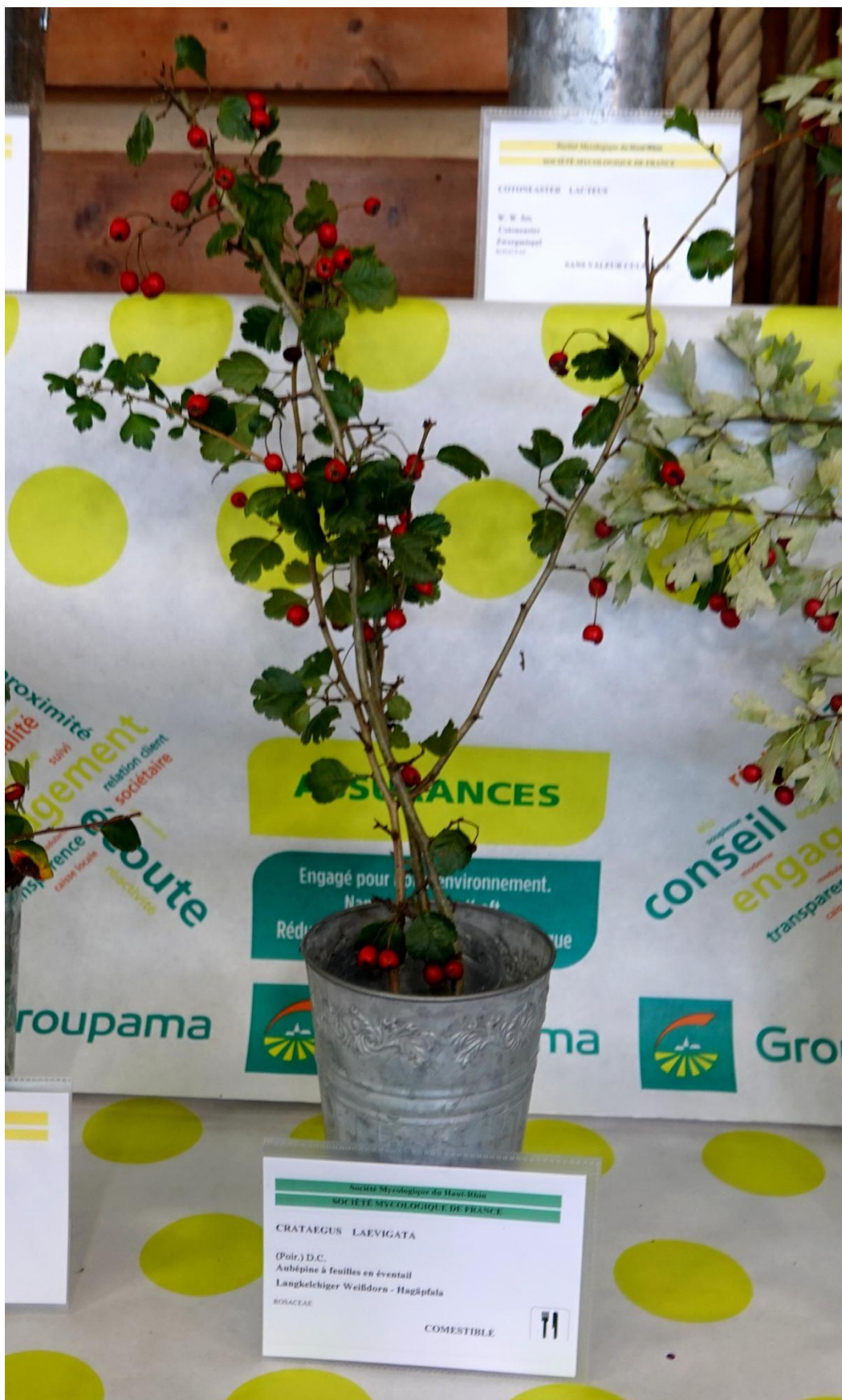
Crataegus laevigata (Poir.) DC., 1825 Aubépine à deux styles - Aubépine lisse - Noble épine - Rosales - Rosaceae