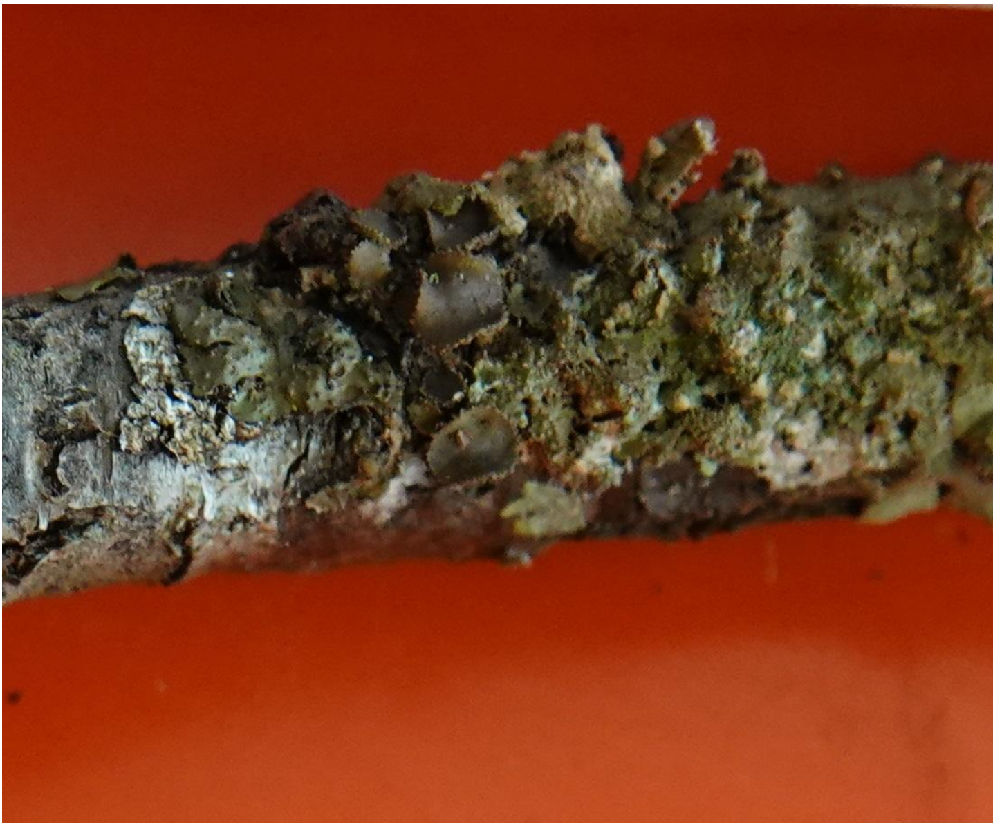
Melanohalea exasperata (De Not.) O. Blanco, A. Crespo, Divakar, Essl., D. Hawksw. & Lumbsch, 2004 Lecanorales - Parmeliaceae