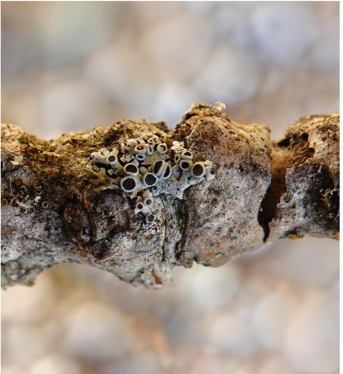
Physcia aipolia (Ehrh. ex Humb.) Fürnr., 1839 - Teloschistales - Physciaceae