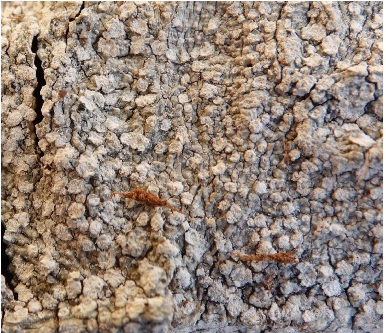
Pertusaria albescens (Huds.) M. Choisy & Werner, 1932 Pertusariales - Pertusariaceae