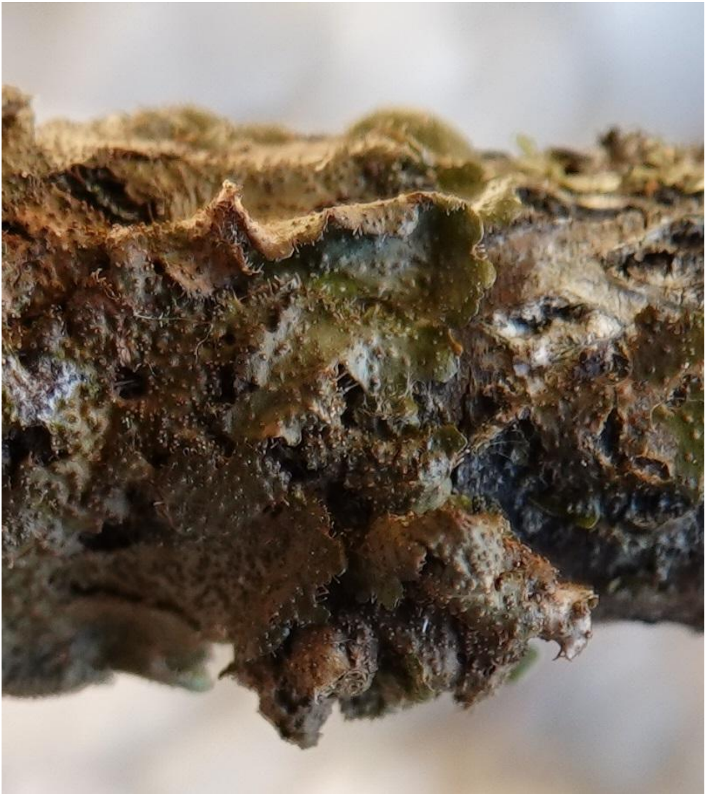
Melanohalea exasperata (De Not.) O. Blanco, A. Crespo, Divakar, Essl., D. Hawksw. & Lumbsch, 2004 Lecanorales - Parmeliaceae