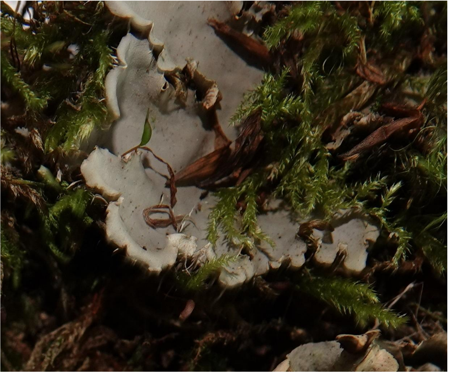
Peltigera membranacea (Ach.) Nyl., 1887 - Peltigerales - Peltigeraceae