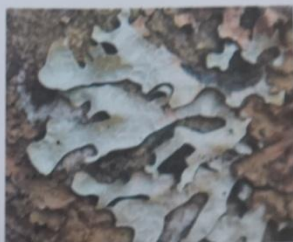
Lobes avec pseudocyphelles

Sur écorce Thalle gris vert, extrémité tronquée Pseudocyphelles blanches en trait Soralies granuleuses confluentes Face inf noire, rhizines noires Cortex K+ jaune, médulle K+ jaune puis rouge