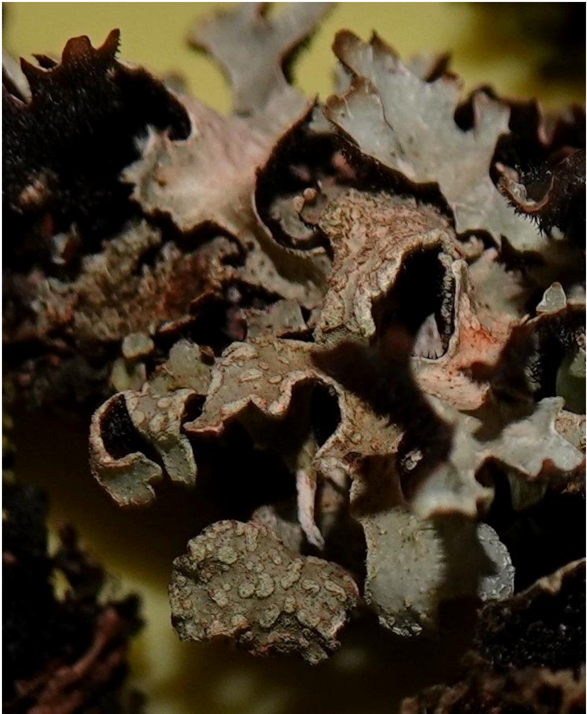
Parmelia sulcata Taylor, 1836 - Lecanorales - Parmeliaceae