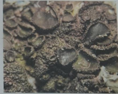
Lobes et verrues

Thalle brun à brun vert Très nombreuses verrues coniques Nombreuses apothécies à disque brun et marge bordée de verrues Face inf brun foncé à noire Cortex et Médulle K-, C-