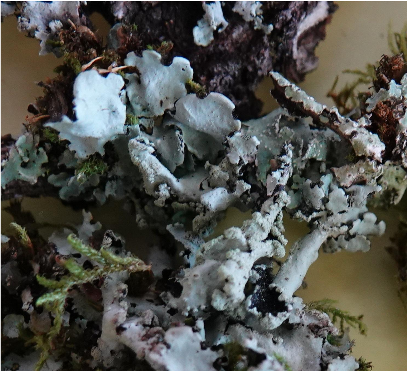
Hypotrachyna revoluta (Flörke) Hale, 1975 - Lecanorales - Parmeliaceae