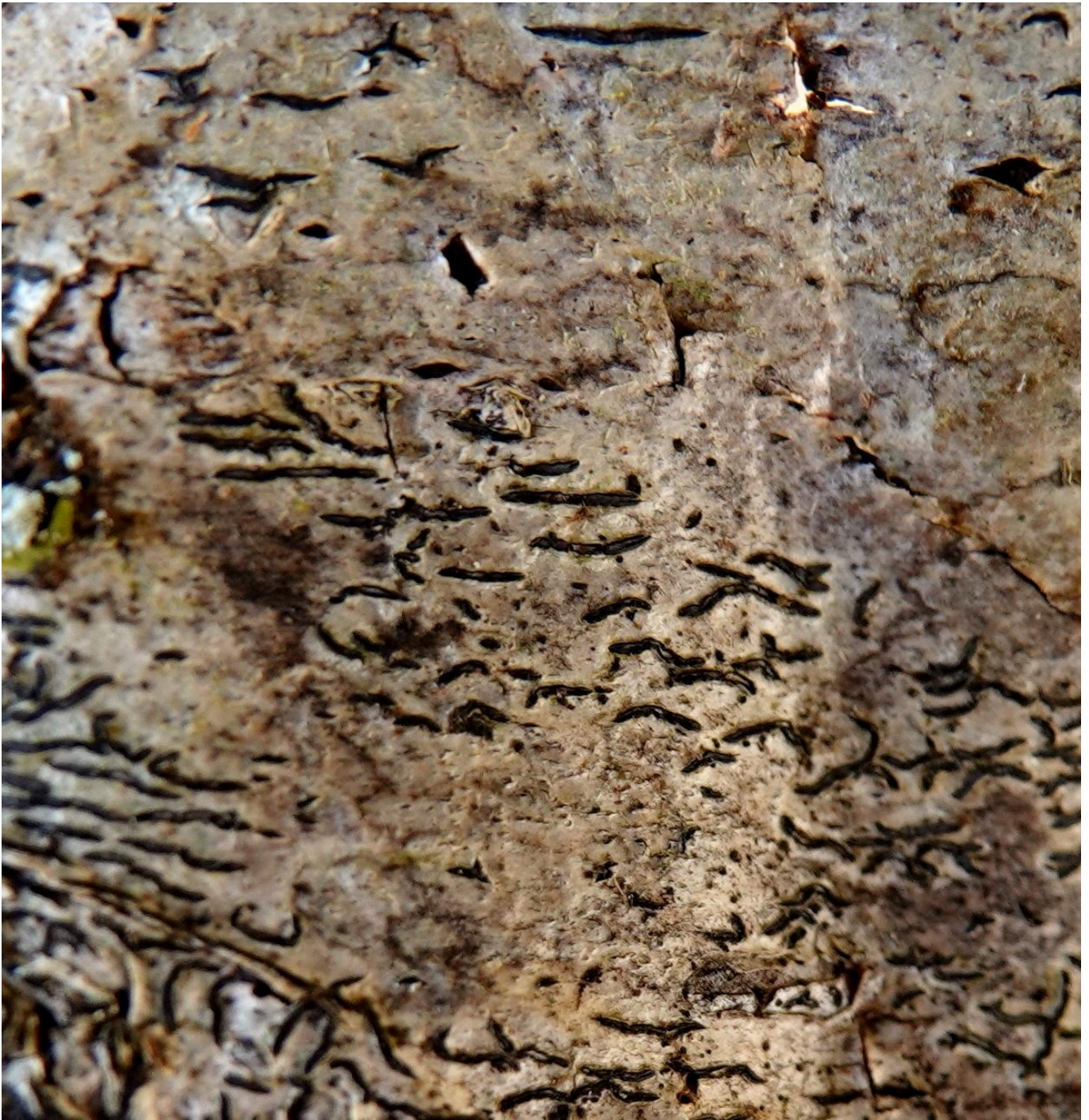
Graphis scripta (L.) Ach., 1809 - Ostropales - Graphidaceae