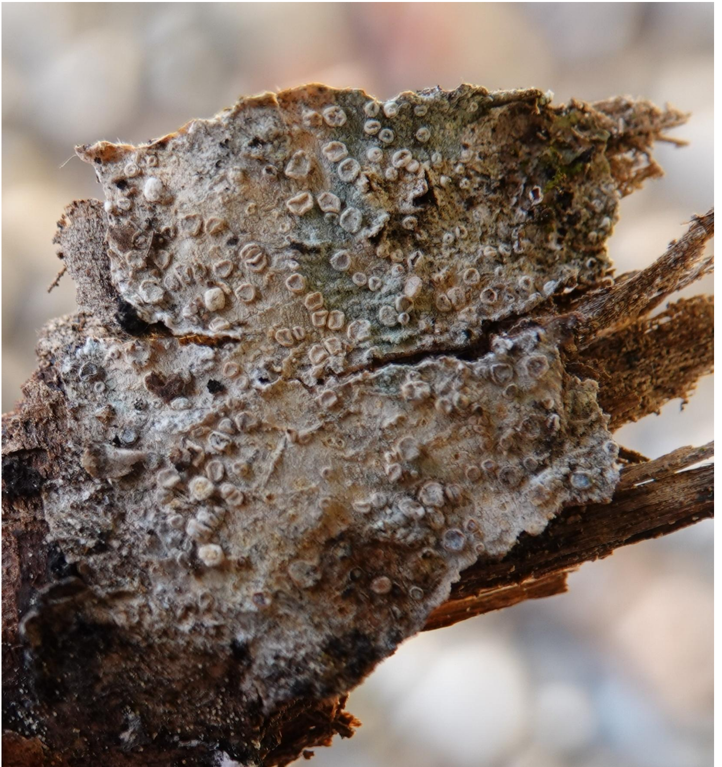
Lecanora chlarotera Nyl., 1872 - Lecanorales - Lecanoraceae