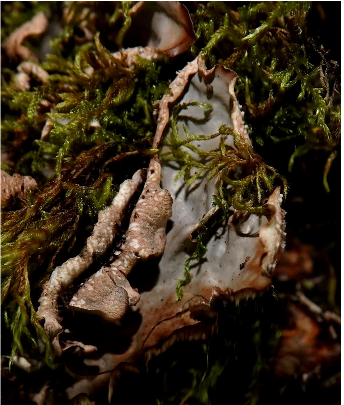
Peltigera horizontalis (Huds.) Baumg., 1790 - Peltigerales - Peltigeraceae