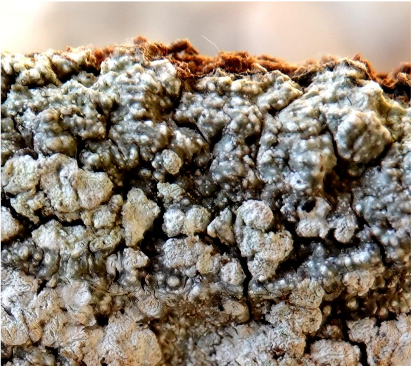
Pertusaria amara (Ach.) Nyl., 1872 - Pertusariales - Pertusariaceae