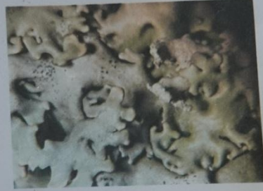
Lobes et soralies

Thalle gris, +/- appliqué Lobes creux Soralies labriformes, lobe ouvert Face inf noire, brune au bord Pas de rhizines Médulle P+ orangé