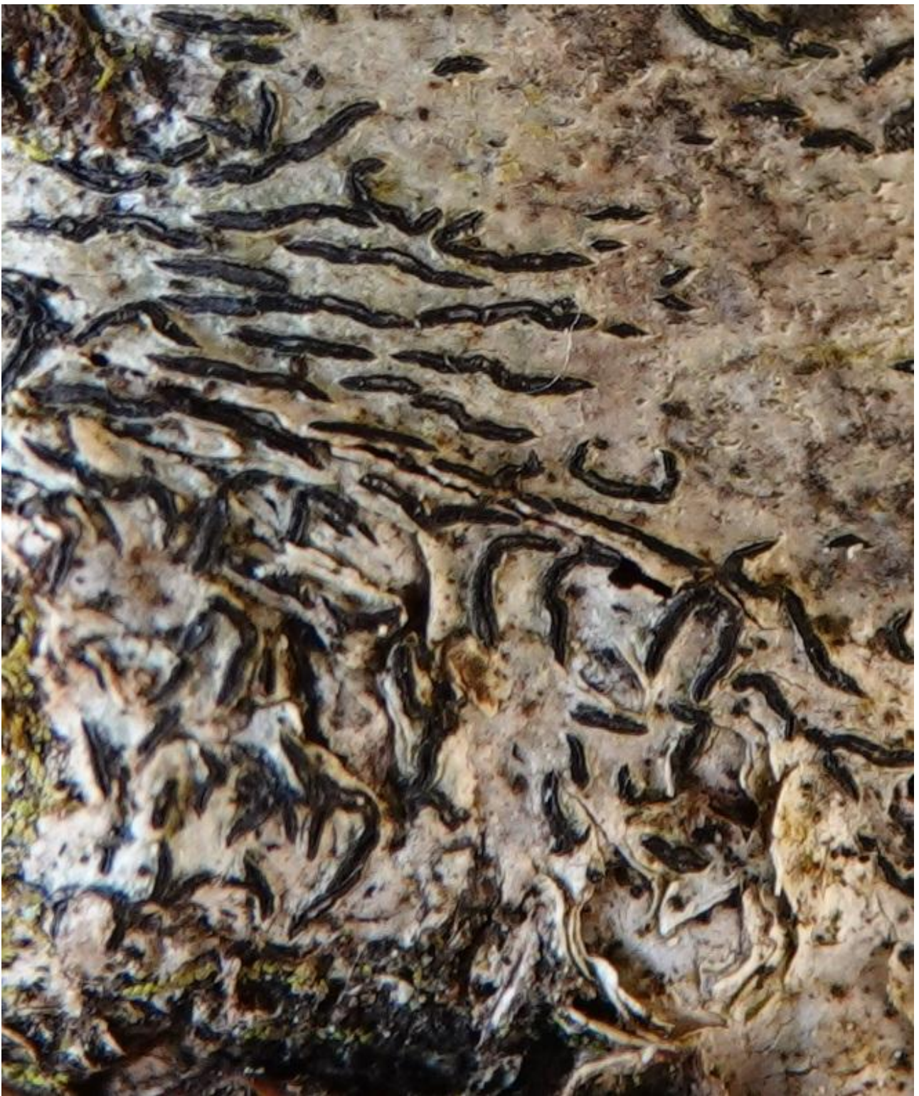
Graphis scripta (L.) Ach., 1809 - Ostropales - Graphidaceae