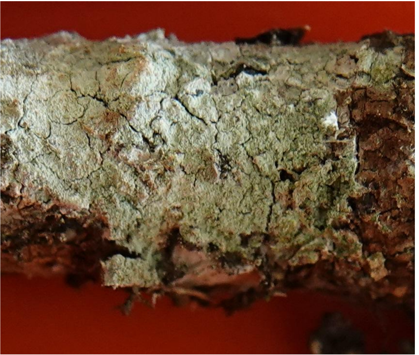
Lepraria lobificans Nyl., 1873 - Lecanorales - Stereocaulaceae