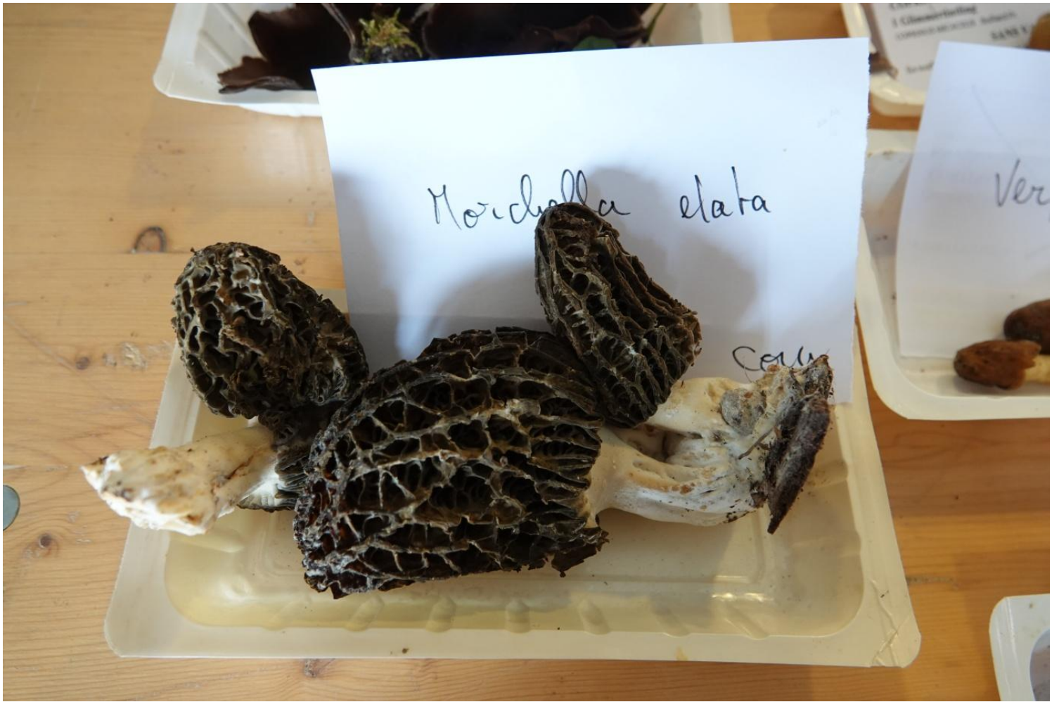
Morchella elata Fr., 1822 - Morille élevée - Pezizales - Morchellaceae