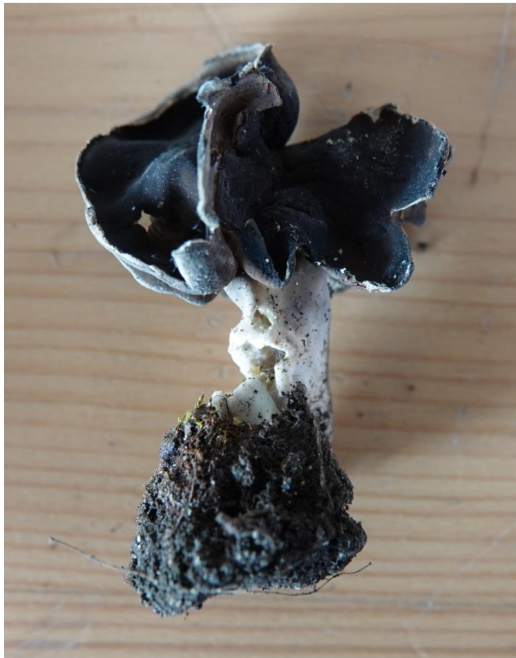
Helvella spadicea Schaeffer - Pezizales - Helvellaceae