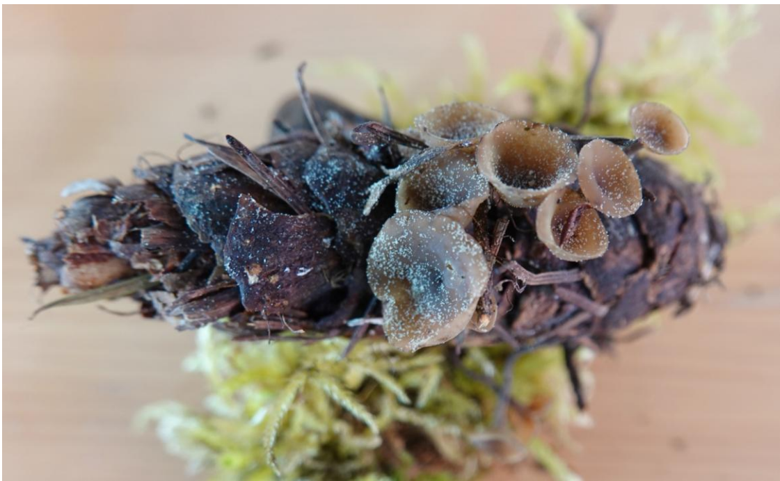
Ciboria rufofusca (O. Weberb.) Sacc., 1889 - Helotiales - Sclerotiniaceae