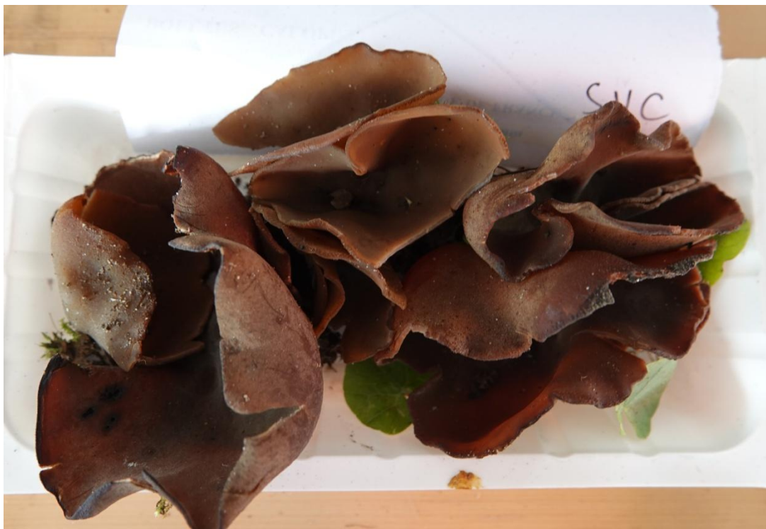
Phylloscypha phyllogena (Cooke) Van Vooren, 2020 Synonyme : Peziza badioconfusa Korf, 1954 Pezizales - Pezizaceae