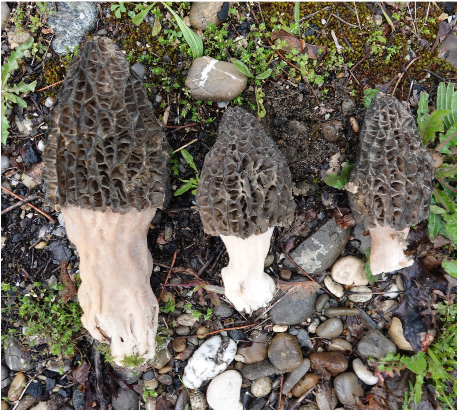
Morchella elata Fr., 1822 - Morille élevée - Pezizales - Morchellaceae