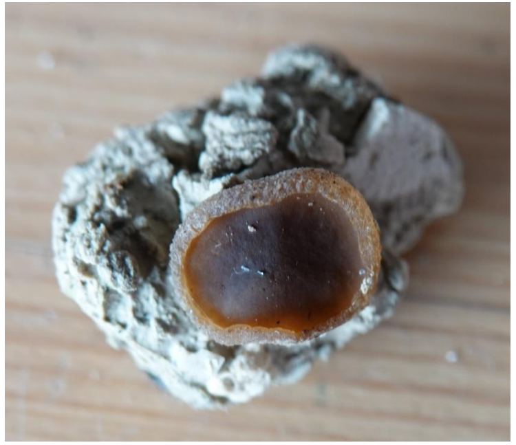
Peziza ampliata Pers., 1822 - Pezizales - Pezizaceae

(Provenance : département 62 - Fabien SARRAILLON)