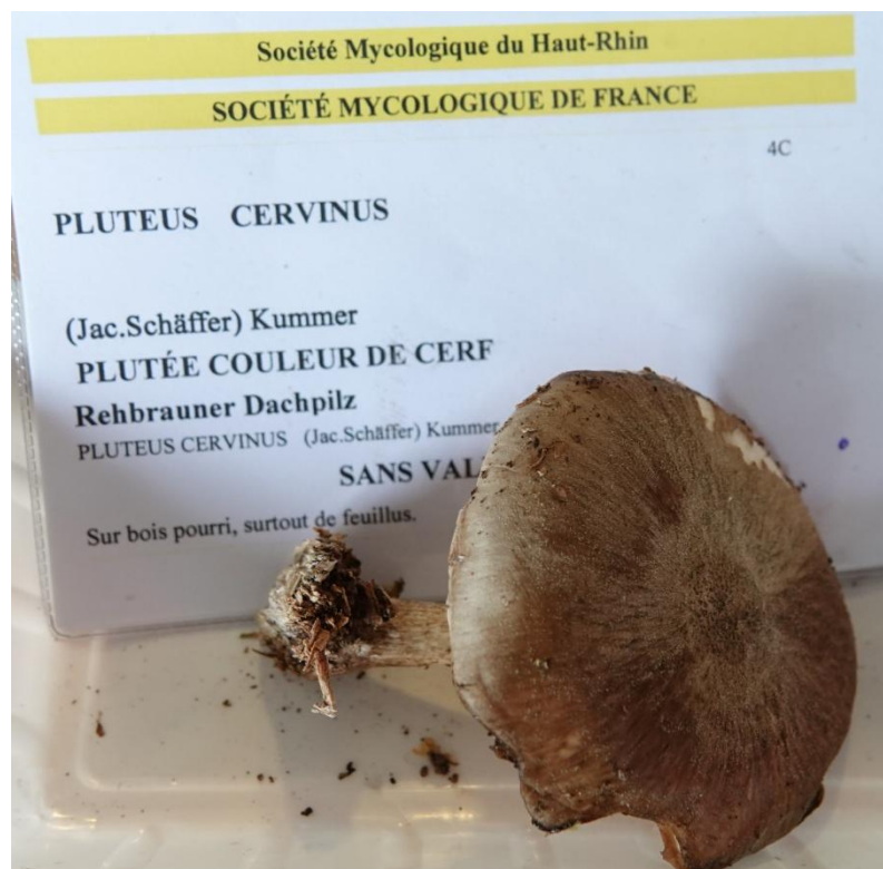
Pluteus cervinus (Schaeff.) P. Kumm., 1871 Plutée couleur de cerf - Pluteales - Pluteaceae