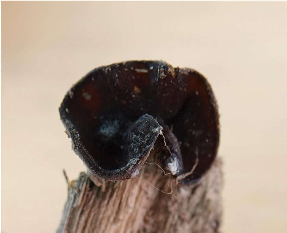
Peziza cf. subuliginosa Donadini, 1984 - Pezizales - Pezizaceae

(Provenance : département 62 - Fabien SARRAILLON)