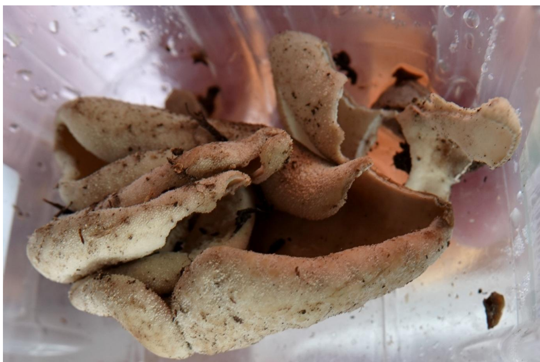
Hypotarzetta insignis (Berthet & Rioussel) Donadini, 1985 Pezizales - Tarzettaceae