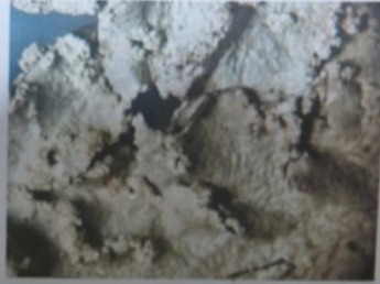
Thalle (pl. soralies)

Thalle vert jaune assez grand Surface ridée au centre Soralies granuleuses denses Face inf noire, brune au bord Cortex K- Médulle K+ jaune, P+ orgé