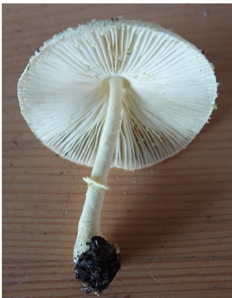
Leucocoprinus birnbaumii (Corda) Singer, 1962 Lépiote jaune - Agaricales - Secotiaceae