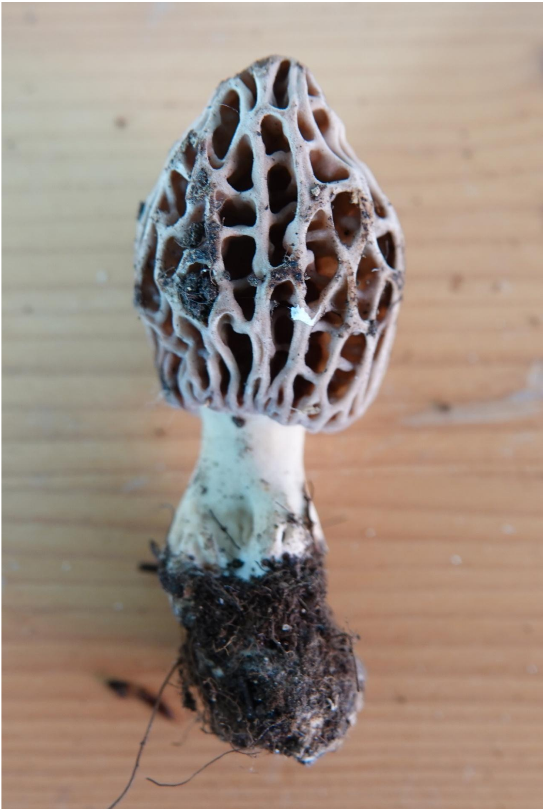
Morchella deliciosa Fr., 1822 - Morille conique - Pezizales - Morchellaceae