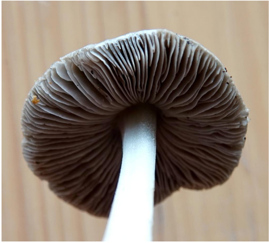
Pluteus cinereofuscus J.E. Lange, 1917 Plutée gris sombre - Pluteales - Pluteaceae