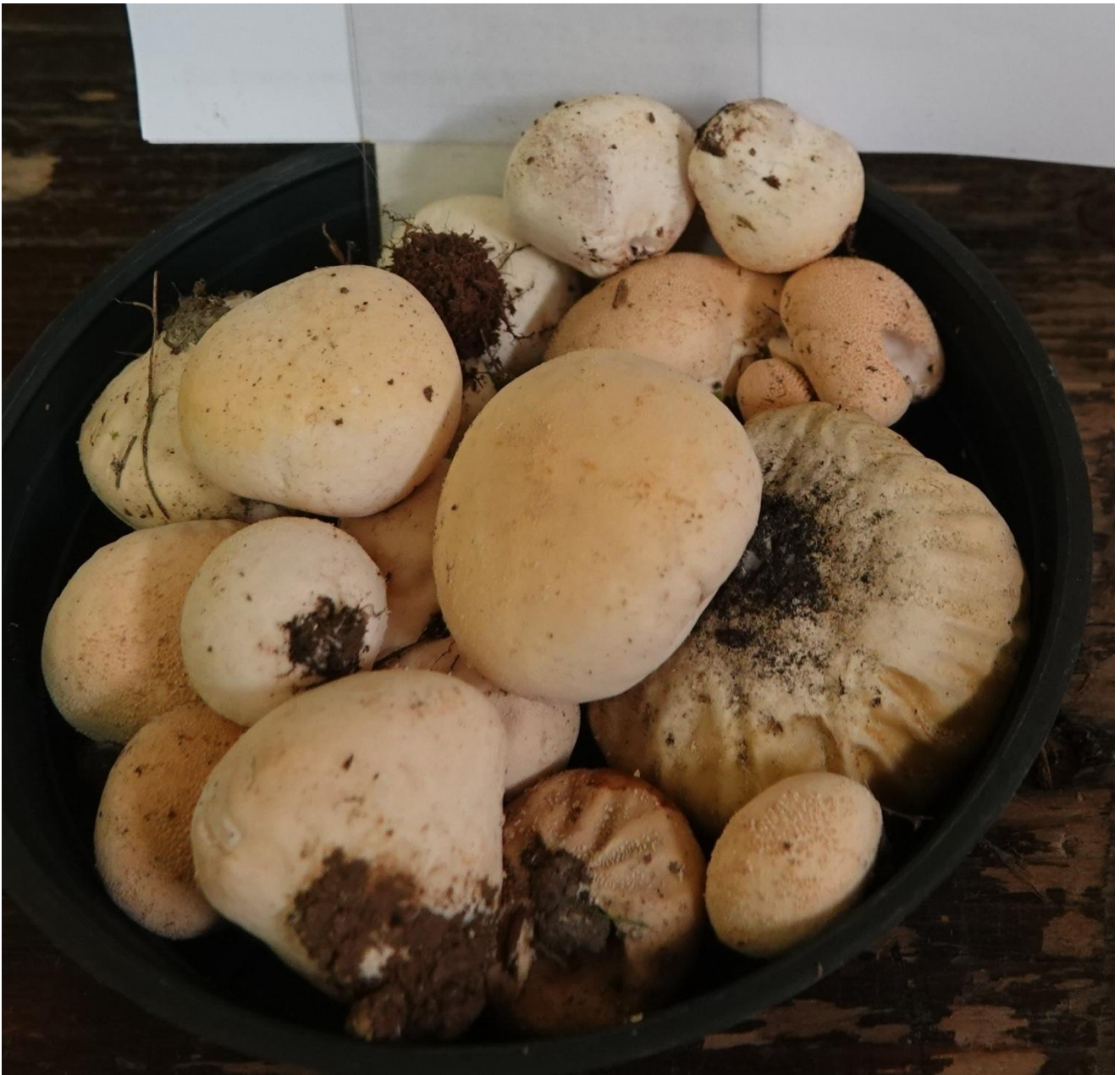
Vascellum pratense (Pers.) Kreisel, 1962 Vesse de loup des prés - Lycoperdales - Lycoperdaceae