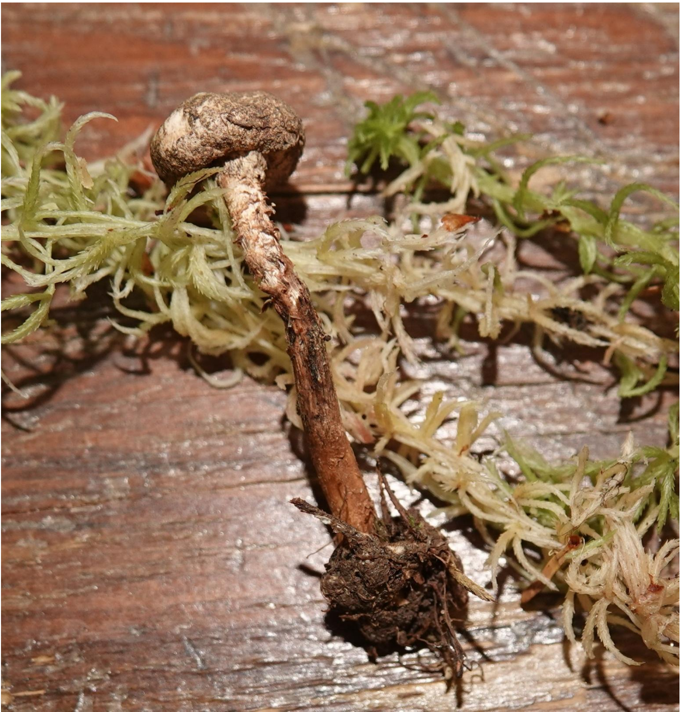
Tulostoma brumale Pers., 1794 Tulostome des brumes - Tulostome mamelonné Agaricales - Tulostomataceae