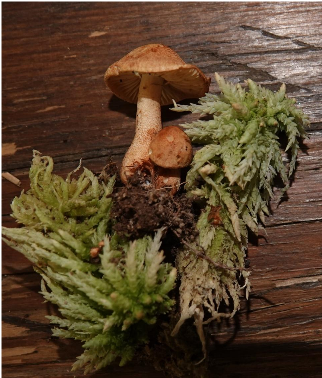
Tricholoma psammopus (Kalchbr.) QuéL., 1875 Agaricales - Tricholomataceae