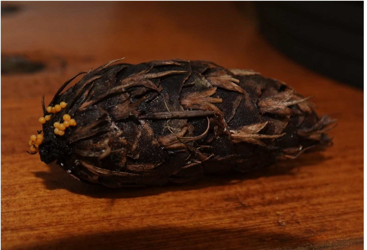
Trichia varia (Pers. ex J.F.Gmel.) Pers., 1794 - Trichiales - Trichiaceae