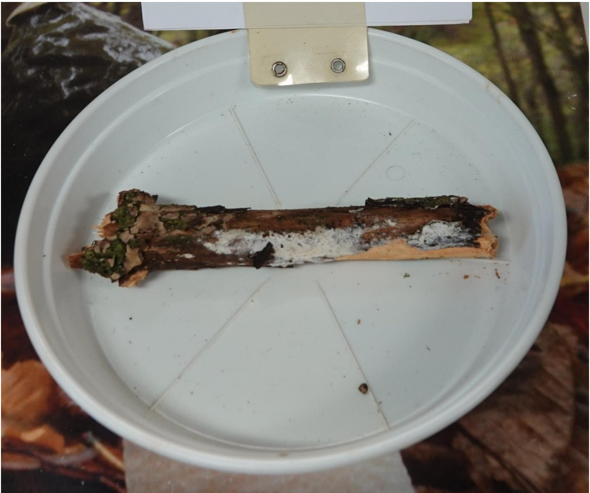
Xylodon sambuci (Pers.) Tura, Zmitr., Wasser & Spirin, 2011 Synonyme : Lyomyces sambuci (Pers.) P. Karst., 1882 Hymenochaetales - Schizoporaceae