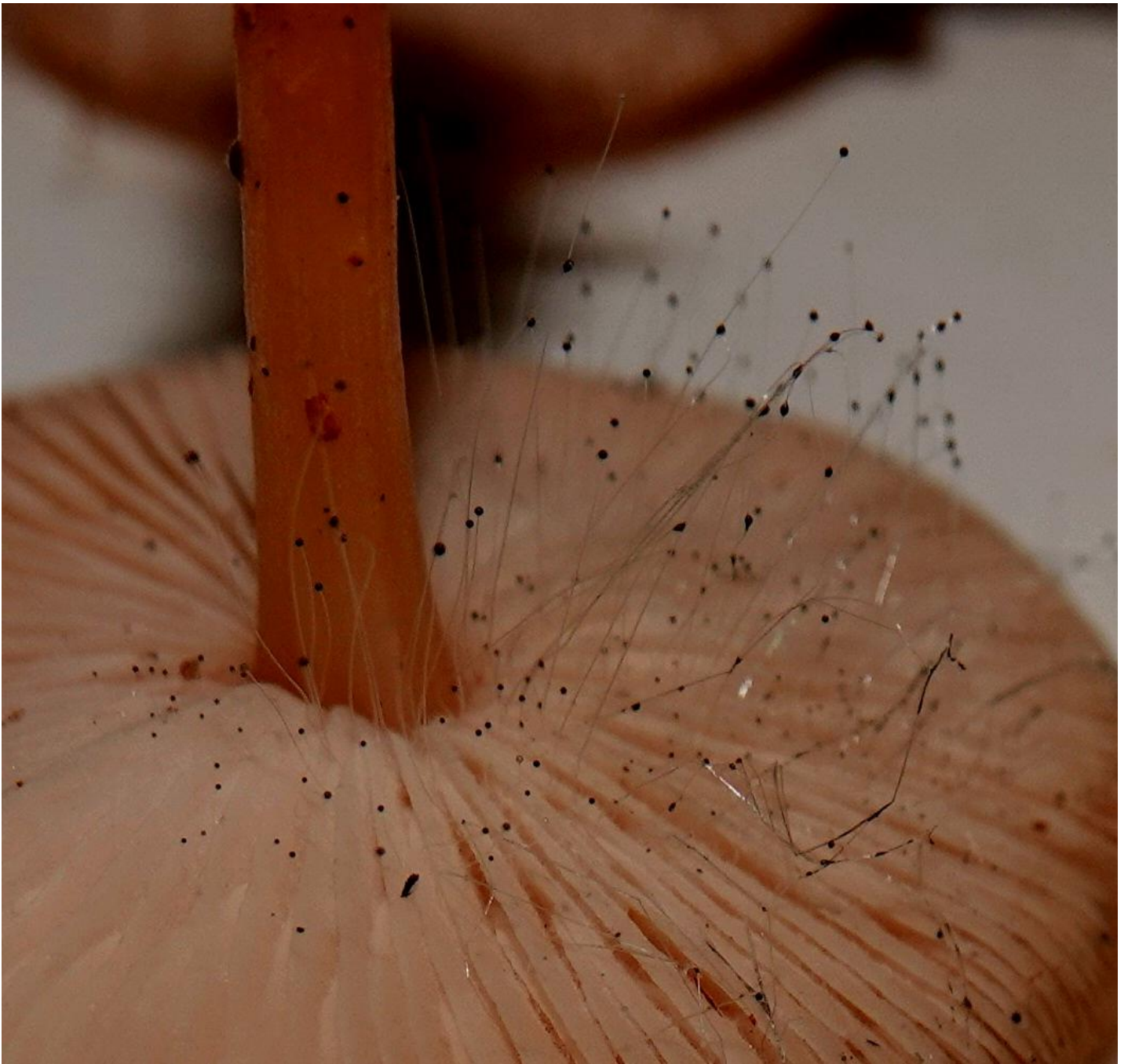
Spinellus fusiger (Link) Tiegh., 1875 - Mucorales - Phycomycetaceae