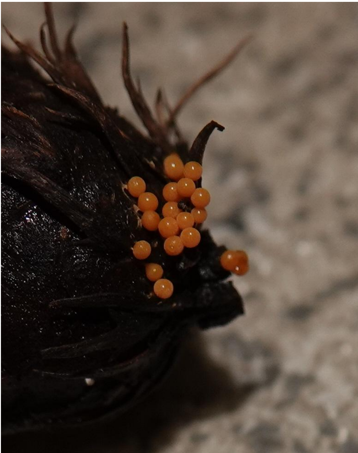
Trichia varia (Pers. ex J.F.Gmel.) Pers., 1794 - Trichiales - Trichiaceae