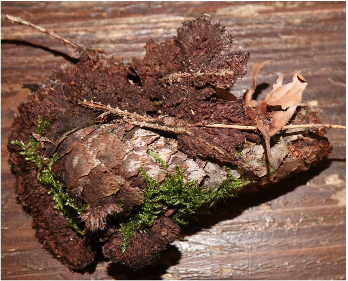
Thelephora terrestris Ehrh., 1793 - Thelephorales - Thelephoraceae