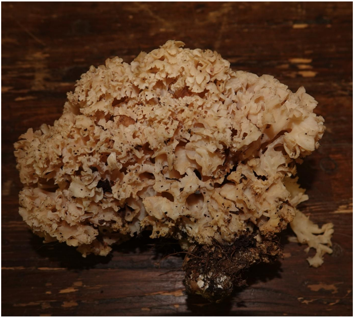
Sparassis crispa (Wulfen) Fr., 1821 Sparassis crépu - Polyporales - Sparassidaceae