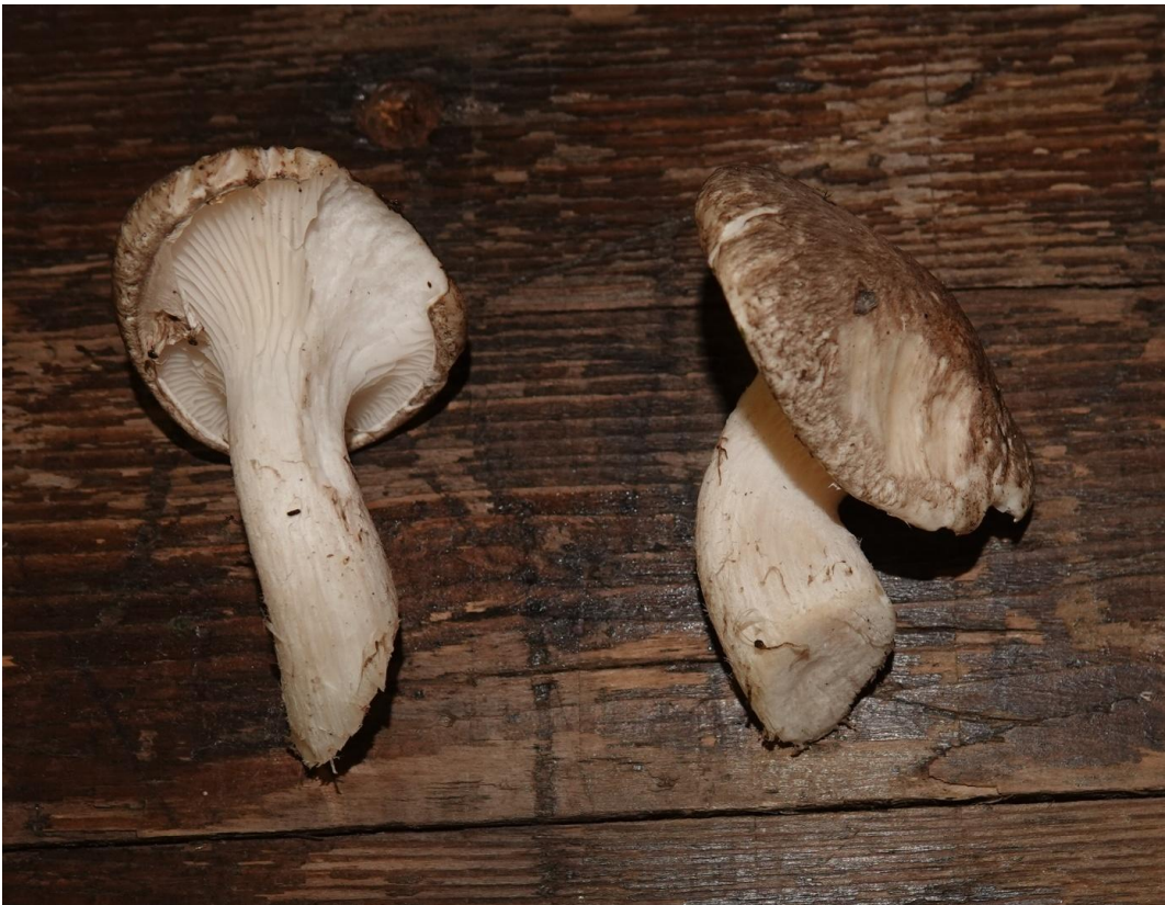
Pleurotus dryinus (Pers.) P. Kumm., 1871 Pleurote du chêne - Tricholomatales - Pleurotaceae