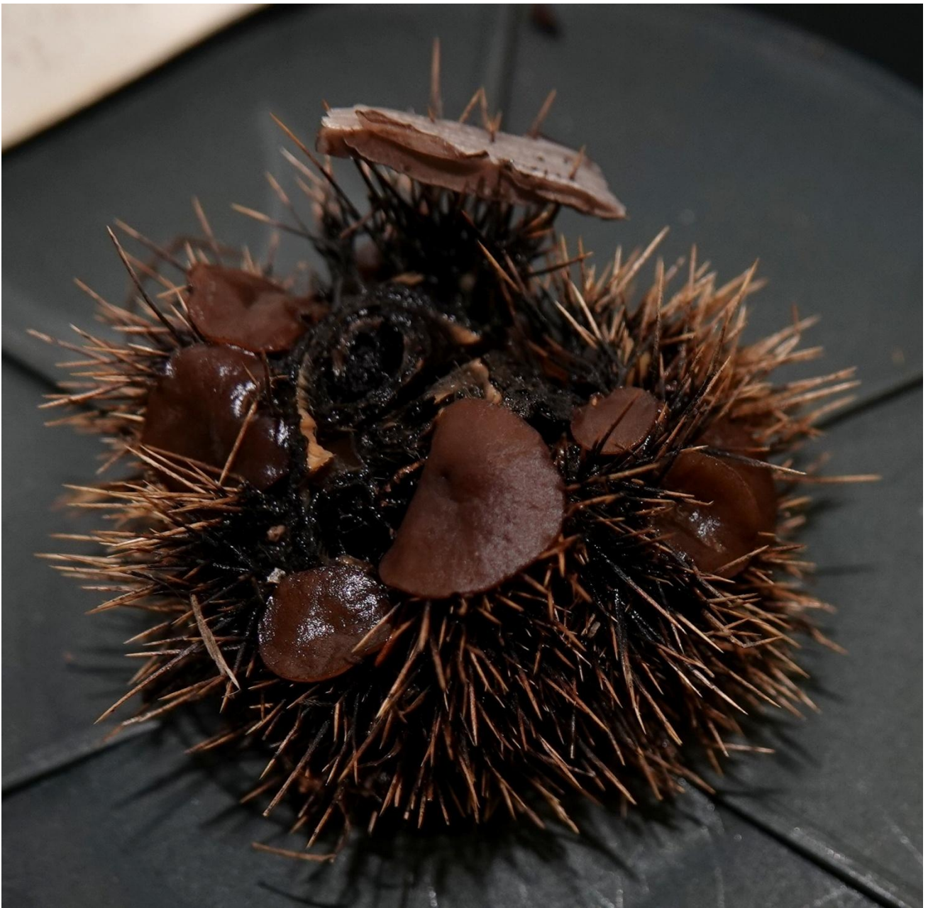
Lanzia echinophila (Bull.) Korf, 1982 - Helotiales - Sclerotiniaceae