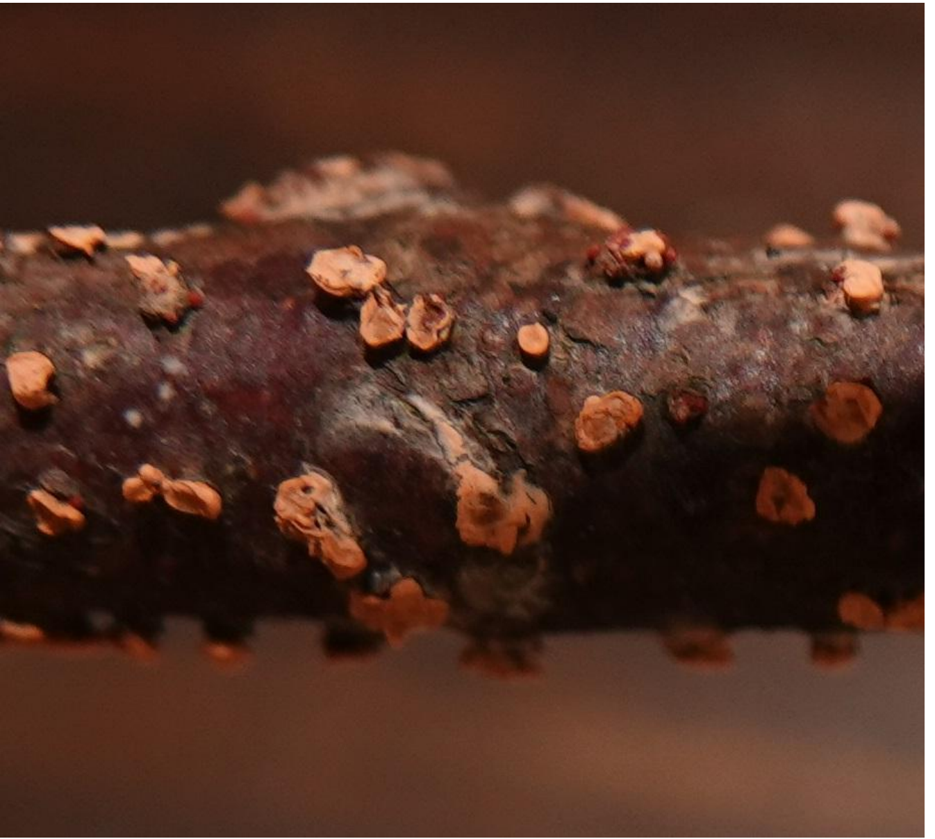
Nectria cinnabarina (Tode) Fr., 1849 - Hypocreales - Nectriaceae