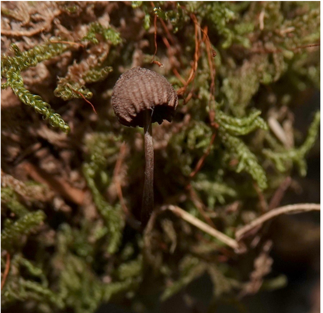
Mycena haematopus (Pers.) P. Kumm., 1871 Mycène à pied rouge - Tricholomatales - Mycenaceae