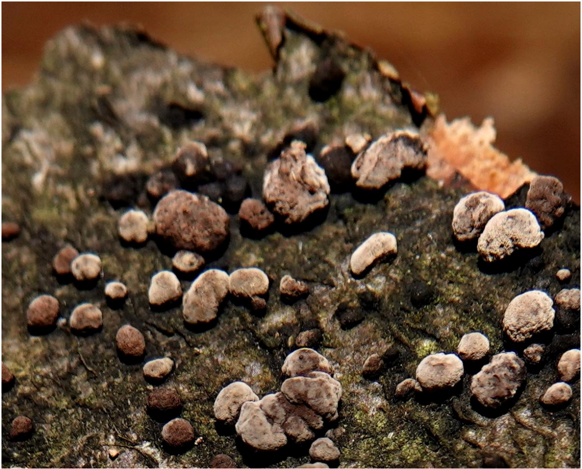
Hypoxylon fragiforme (Pers.) J. Kickx f., 1835 Hypoxylon en forme de fraise - Xylariales - Xylariaceae