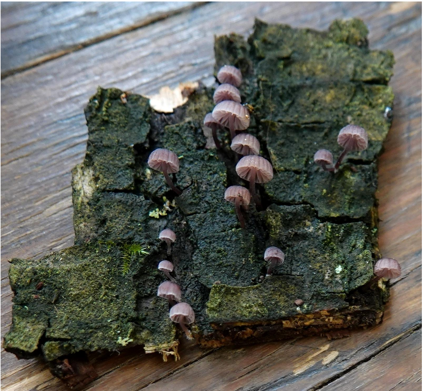
Mycena meliigena (Berk. & Cooke) Sacc., 1887 Tricholomatales - Mycenaceae