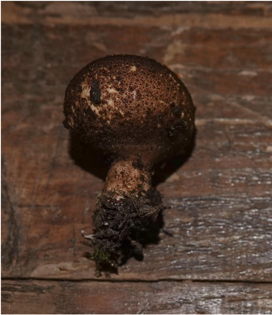
Lycoperdon umbrinum Pers., 1801 - Lycoperdales - Lycoperdaceae