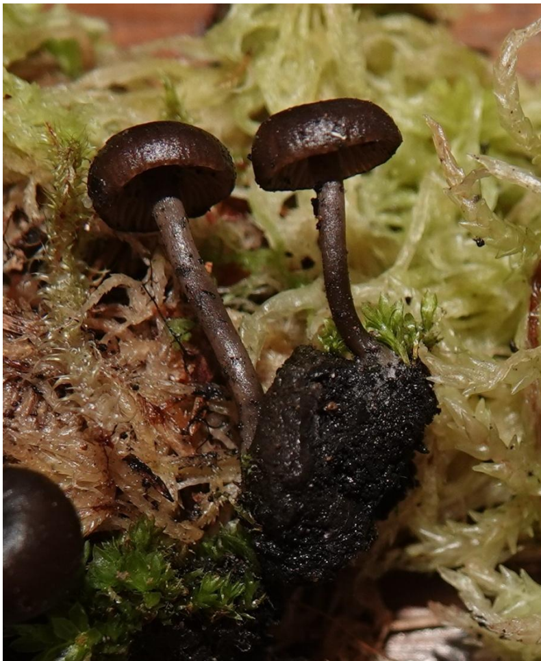
Myxomphalia maura (Fr.) Hora, 1960 - Tricholomatles - Mycenaceae