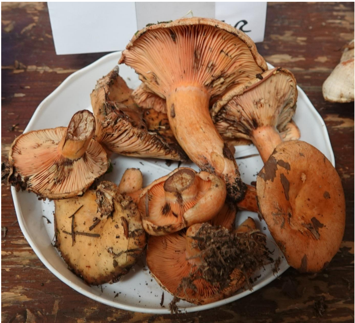
Lactarius salmonicolor R. Heim & Leclair, 1953 Lactaire saumon - Russulales - Russulaceae