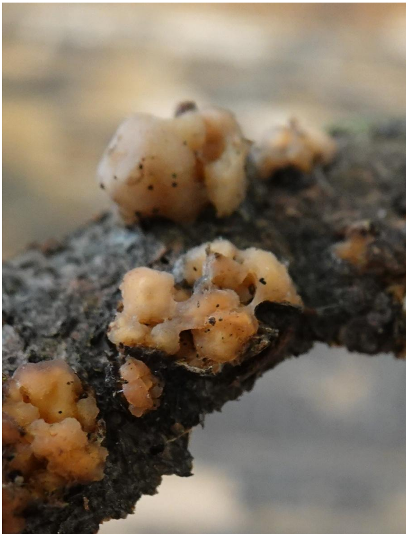
Myxarium nucleatum Wallr., 1833 Synonyme : Exidia nucleata (Schwein.) Burt, 1921 Auriculariales - Exidiaceae