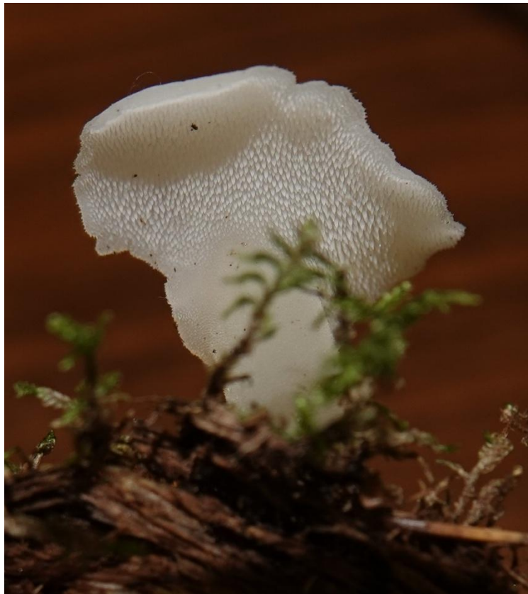
Pseudohydnum gelatinosum (Scop.) P. Karst., 1868 Faux hydne gélatineux - Auriculariales - Exidiaceae