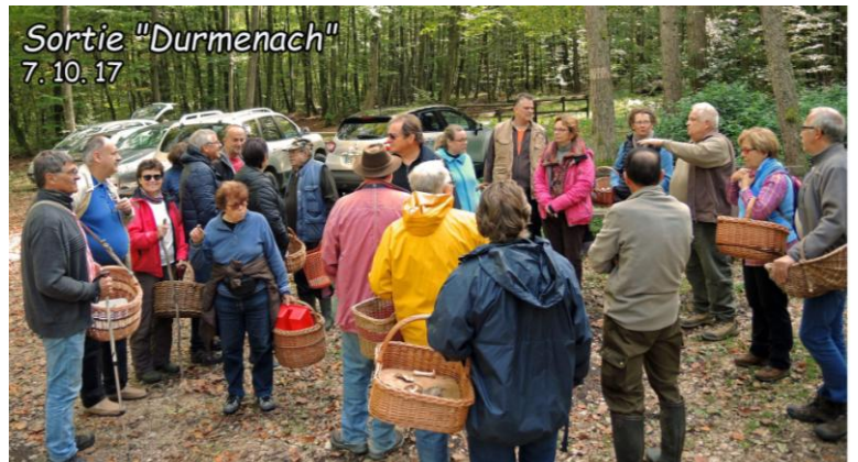
Sortie "Durmenach" 7. 10. 17