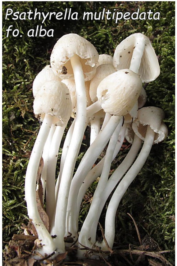
Psathyrella multipedata fo. alba