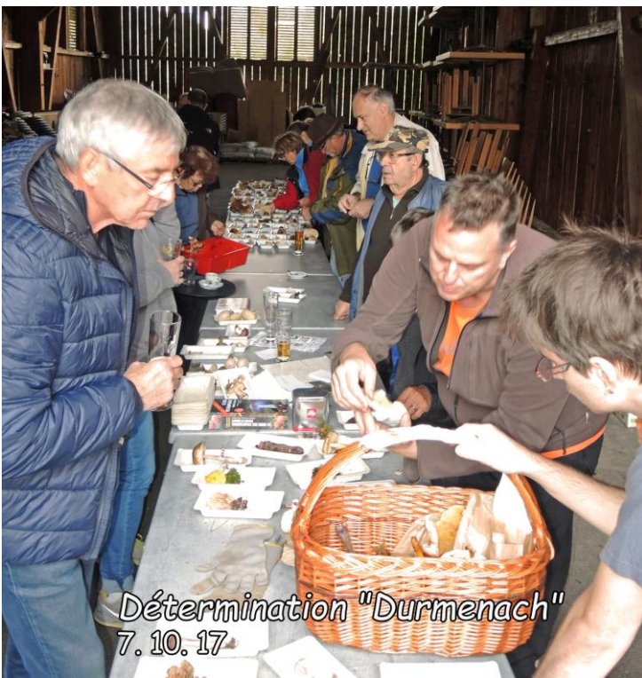
Détermination "Durmenach" 7. 10. 17