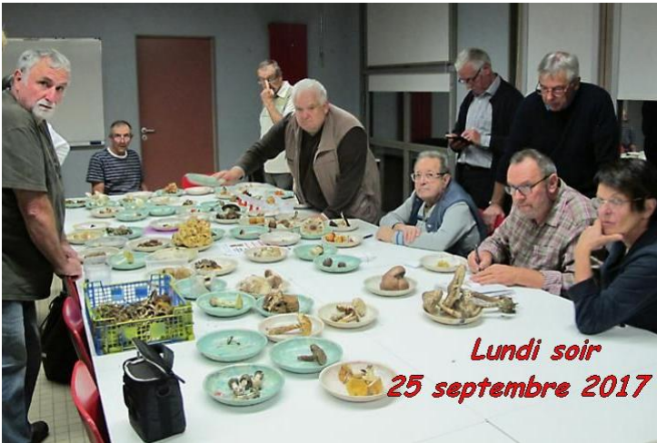
Lundi soir 25 septembre 2017